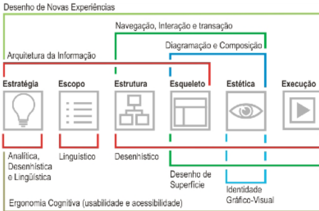
Figura 2 - Diagrama do Projeto E, contemplando uma sexta etapa na proposta inicial de GARRETT (2003), por MEURER & SZABLUK (2009)

uma vez que o método original restringe-se apenas ao projeto e não à execução. Nesse sentido, o Projeto E, de MEURER & SZABLUK (2009) faz importantes contribuições ao método. Definida pelos seus autores como uma “metodologia constituída de conceitos, definições, métodos e processos de autores consagrados em design, estruturados de acordo com as etapas sugeridas por Garrett”, sua proposta acrescenta uma sexta etapa ao método, chamada de etapa de execução.