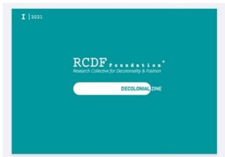
Figura 2: Capa do Decolonial Zine

Fonte: RCDF. Decolonial Zine: Fashion and Decoloniality in Brazil . Netherlands: Research Collective for Decoloniality and Fashion, 2021.