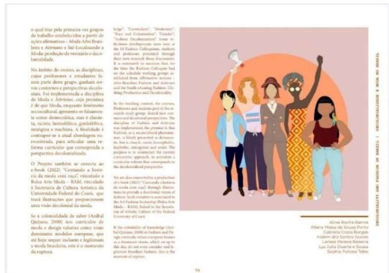
Figura 5: Página interna do Decolonial Zine – Relato da Experiência

Fonte: RCDF. Decolonial Zine: Fashion and Decoloniality in Brazil . Netherlands: Research Collective for Decoloniality and Fashion, 2021.