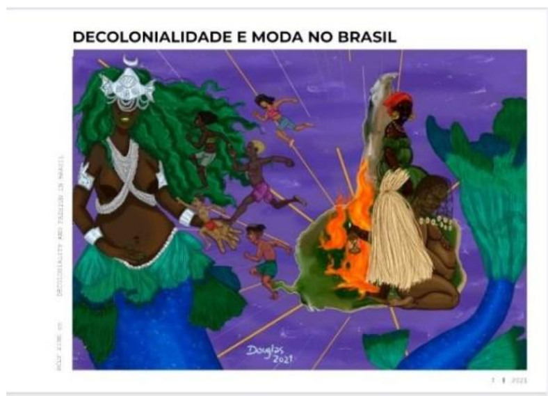
Figura 3: Página interna do Decolonial Zine – Ilustração do estudante Douglas Alves dos Santos