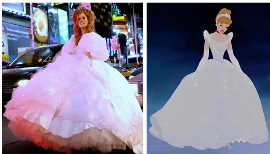
Figura 2: Cena da Times Square em Encantada e cena da transformação em Cinderela.