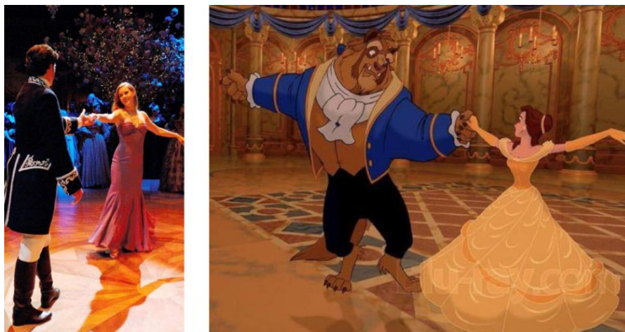
Figura 8: Cena do baile em Encantada e cena da valsa em A Bela e a Fera .

Fonte: Frames retirados dos respectivos filmes Encantada (2007) e A Bela e a Fera (1991).