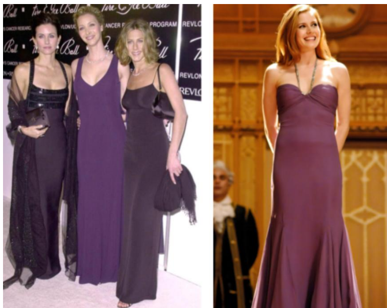
Figura 9: Vestidos anos 2000 e quarto vestido de Giselle.

Fonte: Courteney Cox Wore a Bra and Sheer Top on the Red Carpet With Rachel and Phoebe 13 . / Frame retirado do filme Encantada (2007).