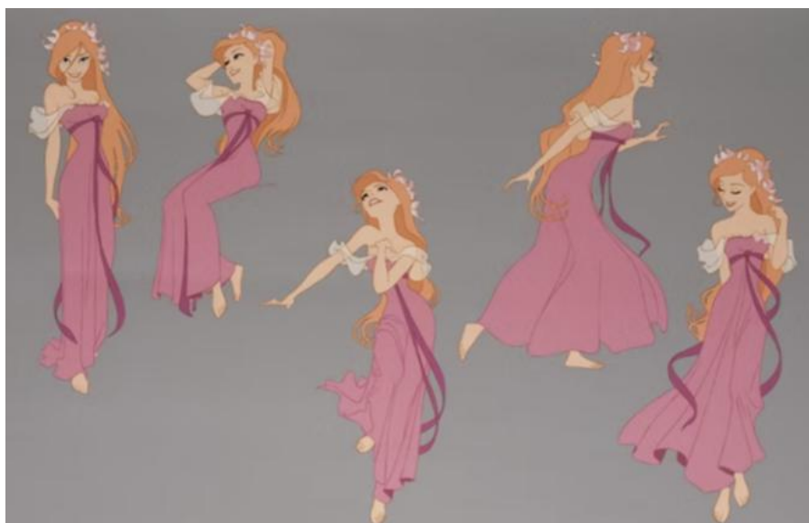
Figura 10: Primeiro figurino de Giselle em Andalusia