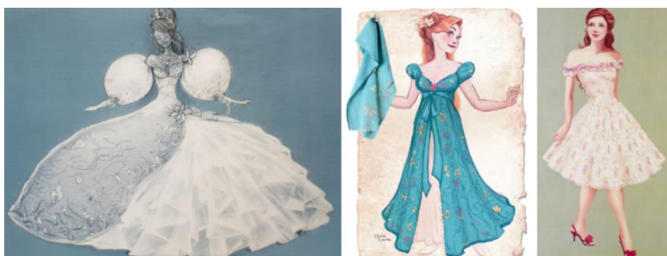
Figura 1: Concepts dos vestidos de Giselle.