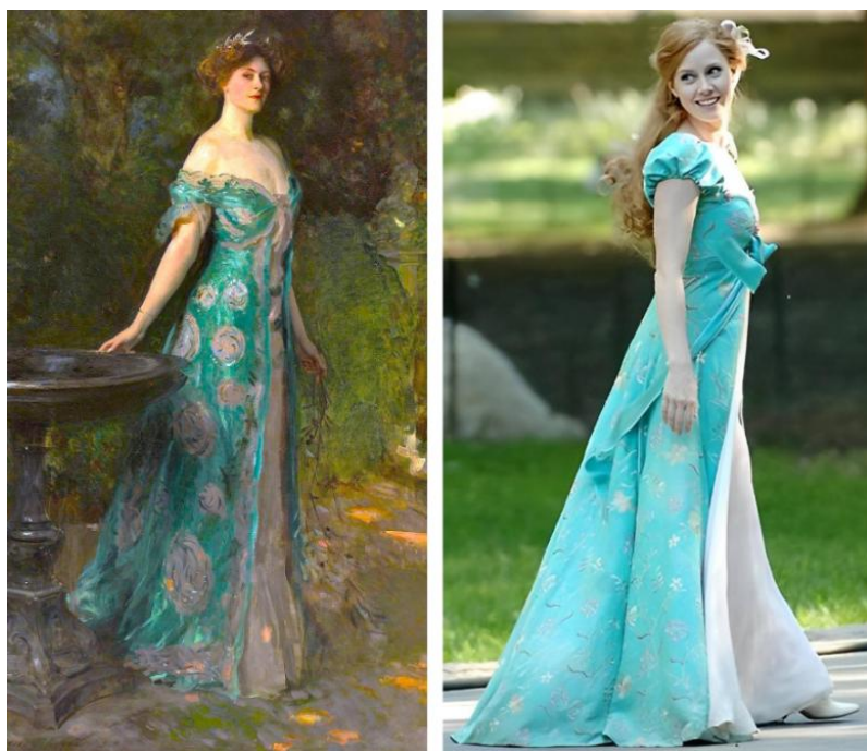
Figura 5: Millicent, Duquesa de Sutherland e segundo vestido de Giselle.

Fonte: Portrait of Millicent, Duchess of Sutherland 9 (Sargent, 1904). / Frame retirado do filme Encantada (Disney, 2007).