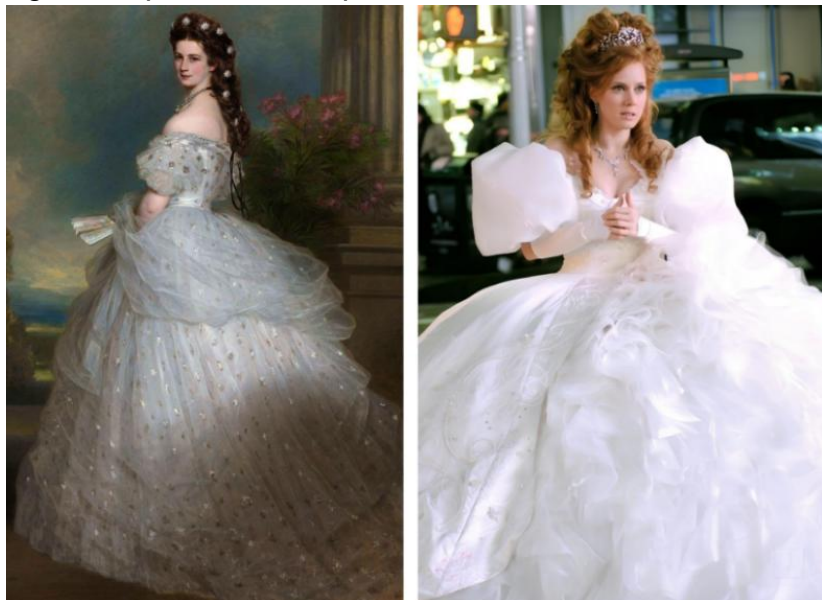
Figura 3: Imperatriz Sissi e o primeiro vestido de Giselle

Fonte: Portrait of Empress Elisabeth of Austria 7 (Winterhalter, 1865). / Frame retirado do filme Encantada (Disney, 2007).