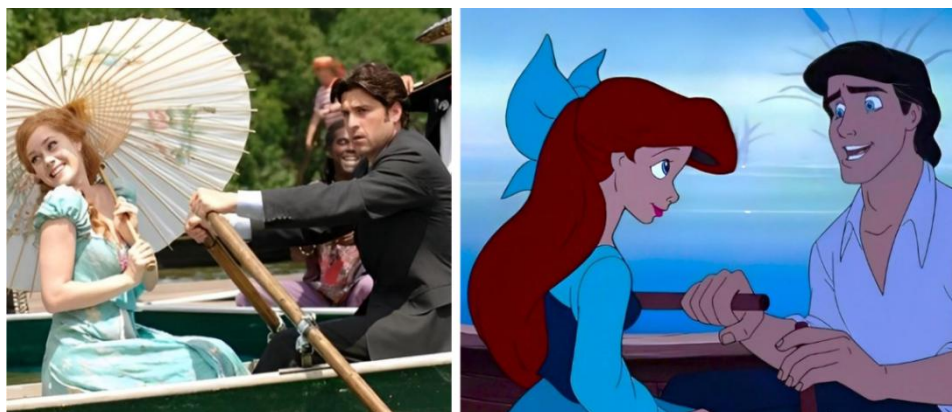
Figura 4: Cena do musical em Encantada e cena do barco em A Pequena Sereia.