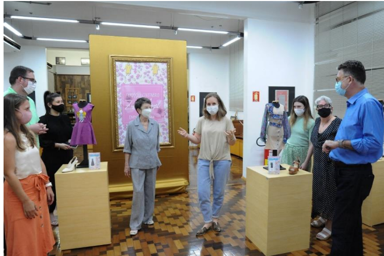
Figura 4 - Abertura da exposição do projeto "Moda e Inclusão"

necessária a criação de uma exposição acessível para pessoas com deficiência visual. Ao final do projeto, foram desenvolvidos catorze looks sensoriais que seguiram um plano projetual detalhado.