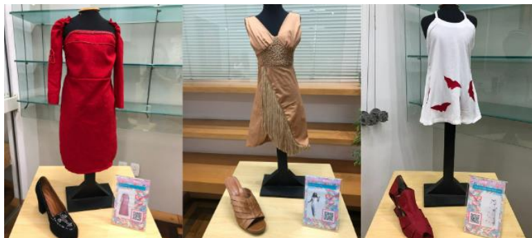
Figura 5 - Exposição Homenagem a Zuzu Angel

conhecimentos das identidades oprimidas, como é o caso das pessoas com corpos atípicos envolvidas na exposição em questão.