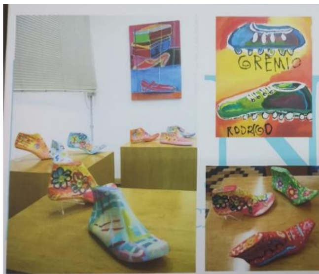
Figura 1 - Registros do projeto mentes brilhantes