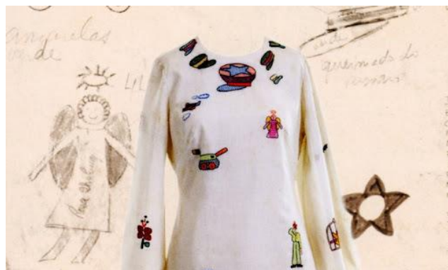
Figura 3 - Criação de Zuzu Angel em posicionamento contrário à ditadura militar no Brasil

Conforme mencionado, na ocasião da ação extensionista estavam sendo comemorados os 100 anos do nascimento de Zuzu Angel, tornando-se um oportuno ponto de partida para reflexões a respeito da moda enquanto ferramenta crítica, portanto, artefato de design, cultural e político.