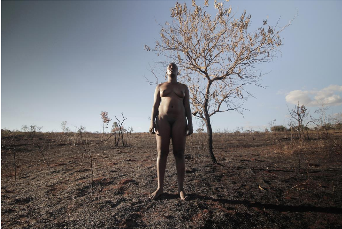
Fig. 4. Ricardo Coelho, Sem Título, 2019. (Performer Lucimélia Romão) Fotografia digital impressa em Fine Art, 80 x 120 cm. São João del-Rei, MG