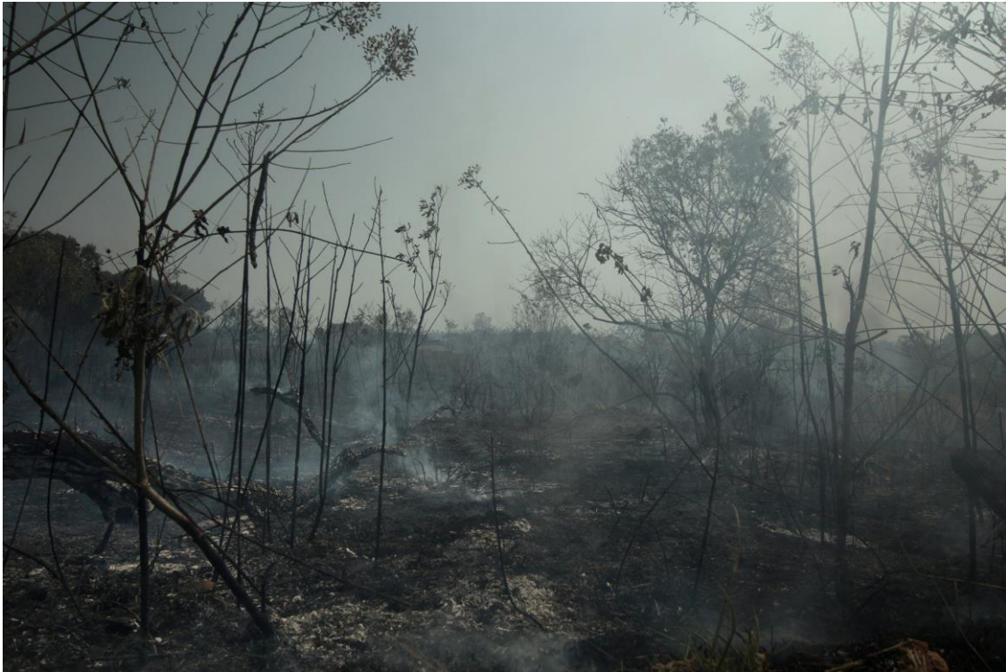
Fig. 2. Ricardo Coelho, Sem Título, 2022 Fotografia digital impressa em Fine Art, 80 x 120 cm. São João del-Rei, MG