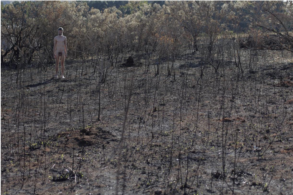
Fig. 7. Ricardo Coelho, Fotografia de Phamela Dadamo, Sem Título, 2019. (Performer Ricardo Coelho) Fotografia digital impressa em Fine Art, 80 x 120 cm. São João del-Rei, MG