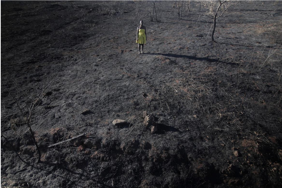
Fig. 8. Ricardo Coelho, Sem Título, 2019. (performer Lucimélia Romão) Fotografia digital impressa em Fine Art, 80 x 120 cm. São João del-Rei, MG