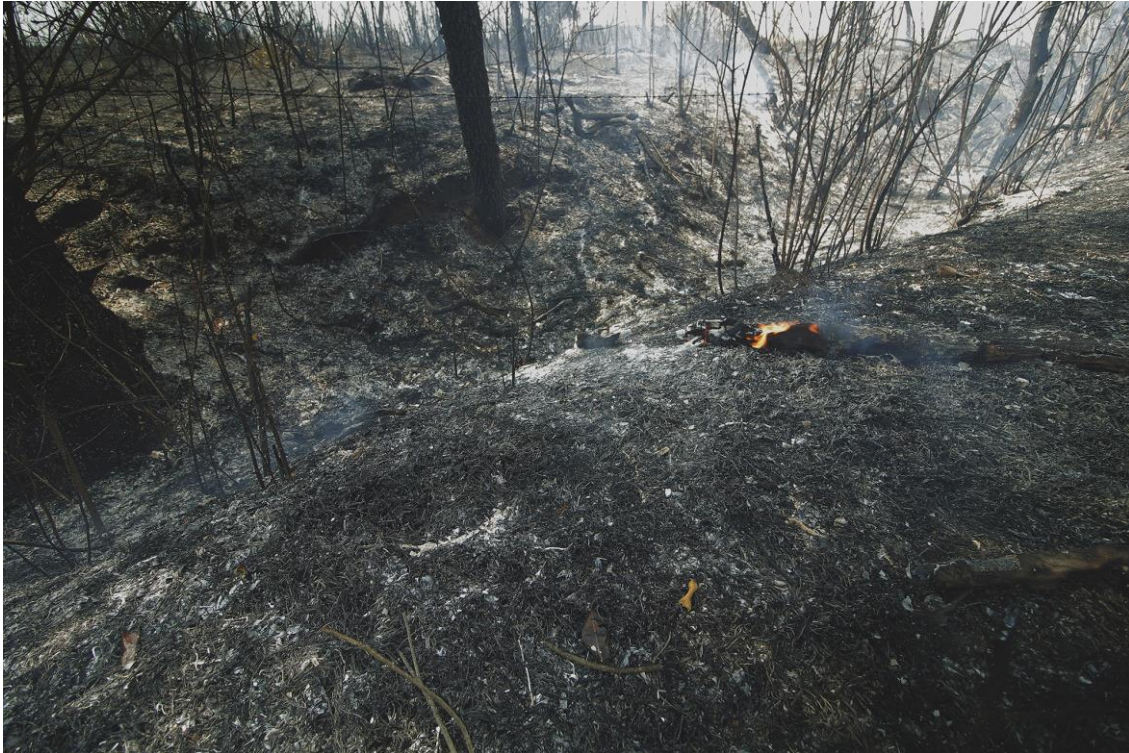
Fig. 3. Ricardo Coelho, Sem Título, 2022 Fotografia digital impressa em Fine Art, 80 x 120 cm. São João del-Rei, MG