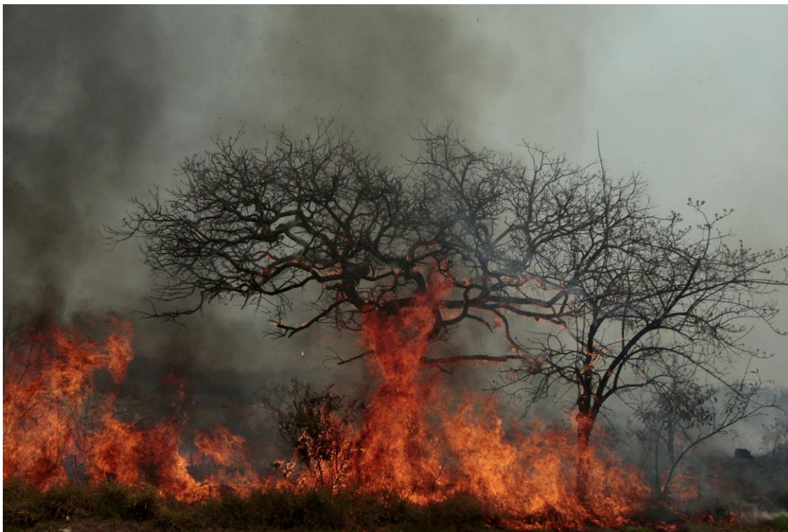
Fig. 1. Ricardo Coelho, Sem Título, 2022 Fotografia digital impressa em Fine Art, 80 x 120 cm. São João del-Rei, MG