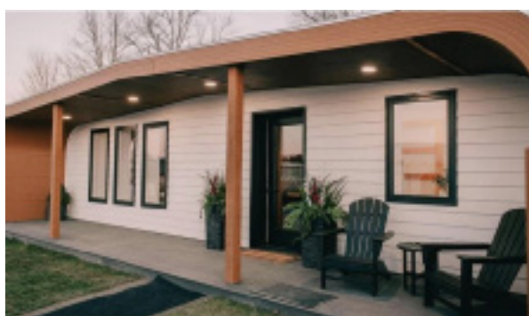
Figura 1 - Casa de base biológica impressa em 3D

Além disso, as impressoras 3D podem ser desenvolvidas para fabricar estruturas a partir de materiais orgânicos, sustentáveis e renováveis. Assim, ao usar menos materiais, gerar menos resíduos e potencialmente usar materiais naturais recicláveis ou biodegradáveis, os edifícios impressos podem reduzir significativamente sua pegada ecológica. Esta tecnologia pode ser a chave para criar edifícios sustentáveis e escaláveis no mercado imobiliário atual. A primeira casa impressa em 3D, feita inteiramente de materiais de base biológica a partir de matéria orgânica renovável, foi construída por pesquisadores da Universidade do Maine, EUA (Figura 1).