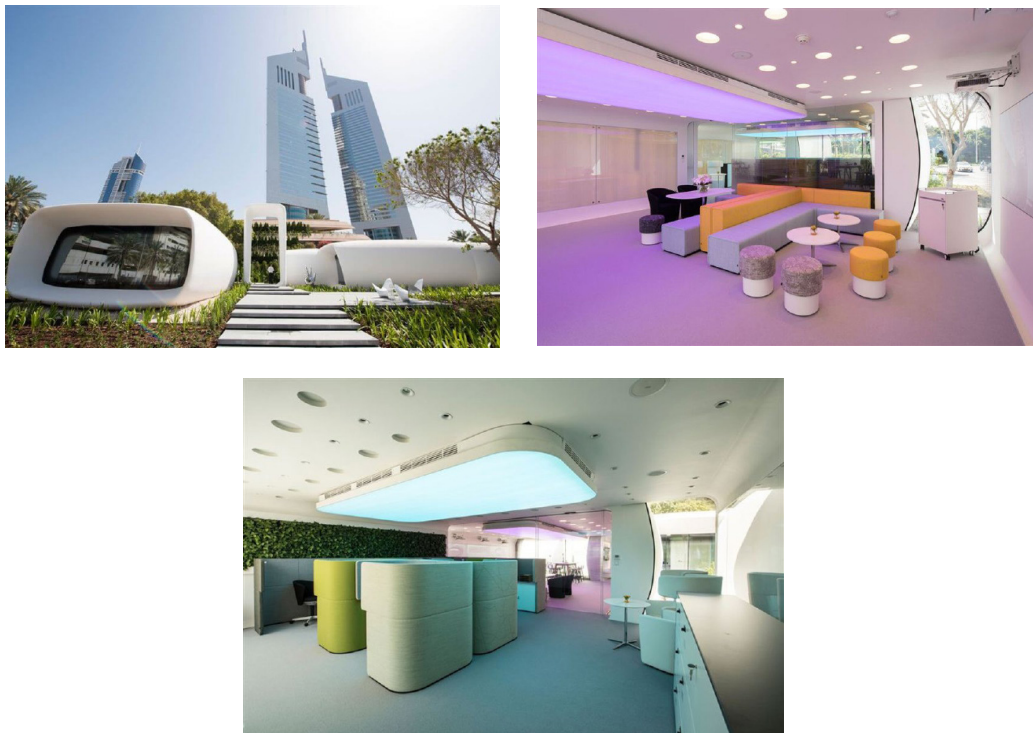
Figura 2 - Escritório do Futuro, Emirados Árabes Unidos/Escritórios feitos em Dubai