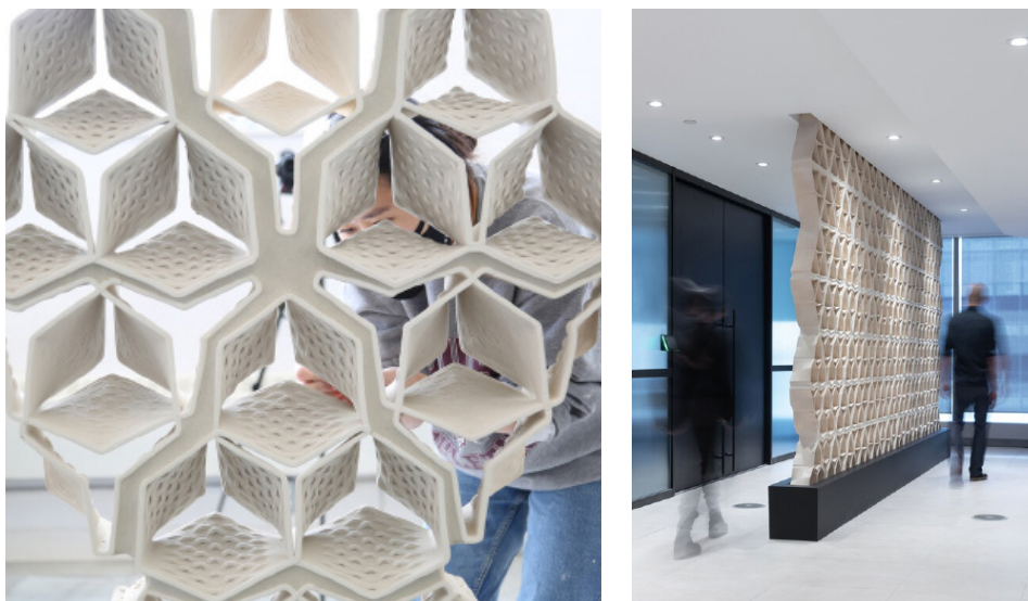
Figura 3 - Parede de alvenaria impressa em 3D