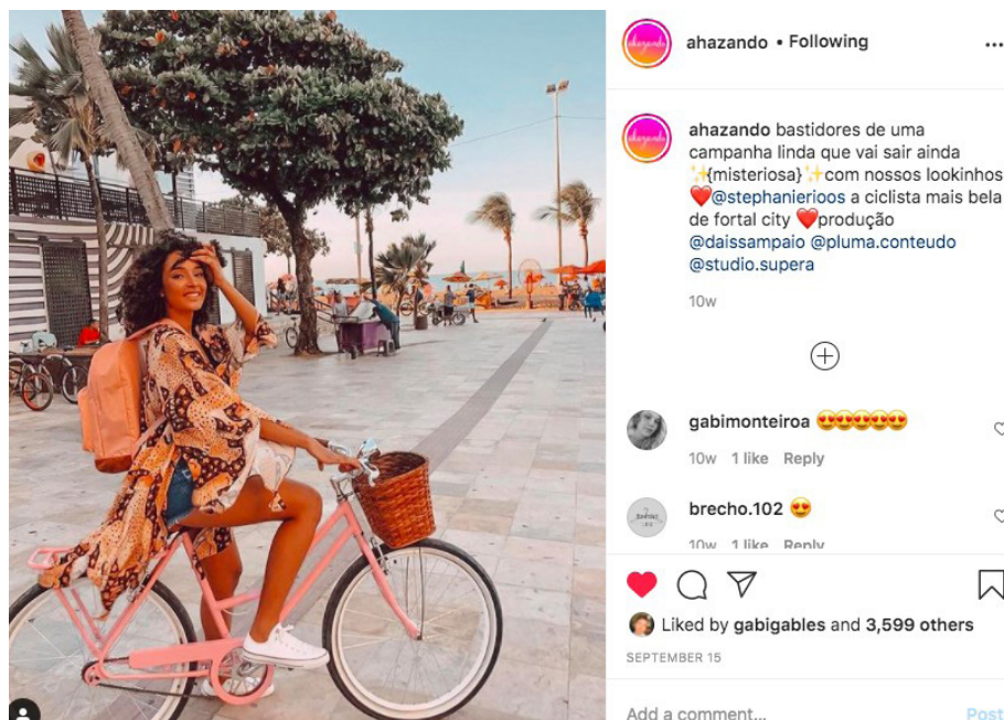
Figura 2 - Postagem da marca Ahazando no Instagram

tal imagem é uma prévia de uma campanha a ser lançada, atestando a intencionalidade da marca em fotografar ali. Vê-se, ainda na legenda, a linguagem despojada, que induz a proximidade – inclusive, cabe observar o uso de caixa baixa e emojis (pequenas imagens dos teclados de smartphones usadas para exprimir algum tipo de emoção e/ou decorar um texto), quebrando regras ortográficas clássicas – e trata a cidade por um apelido: “fortal city”.