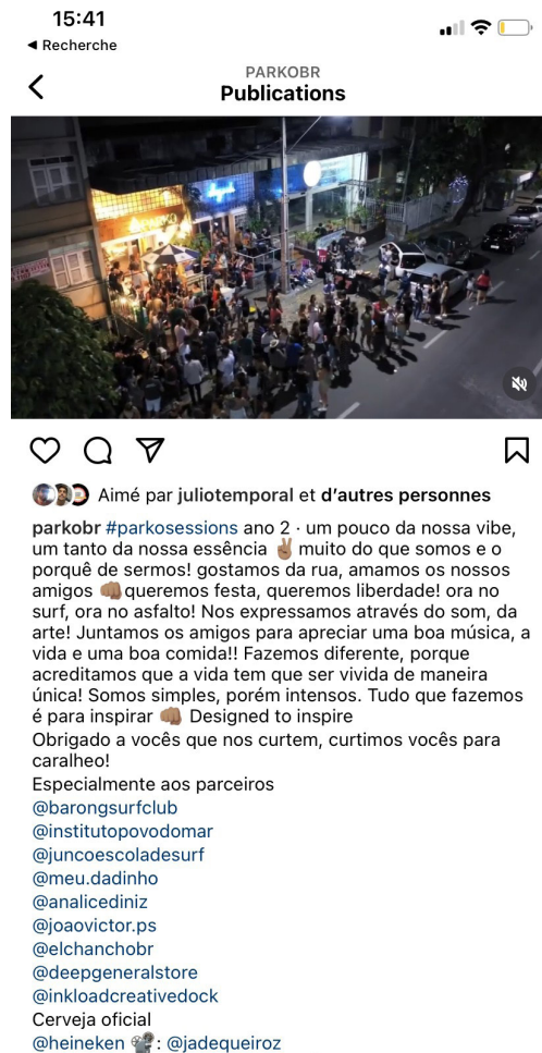
Figura 5 - captura de tela do reels da Parko Sessions