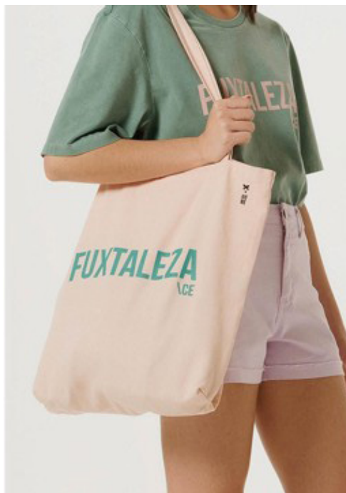
Figura 1 – Coleção Cidades da marca Hering, com bolsa e camiseta com estampa 'Fuxtaleza'.

traziam estampadas o nome 'fuxtaleza', como alguns nativos se referem carinhosamente à cidade. (Figura 1)