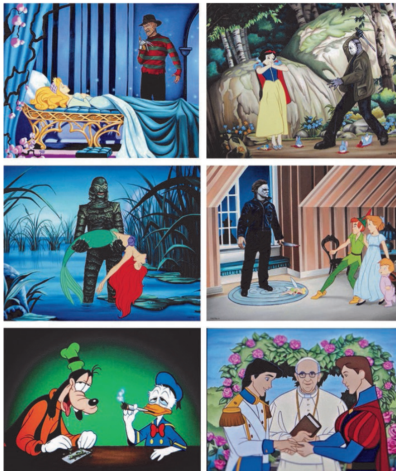
Figura 4 - Ilustrações críticas de José Rodolfo Loaiza Ontiveros. Fonte: Disponível em: https://www.instagram.com/rodolfoaiza . Acesso em: 29 jun. 2020.

Outro ilustrador que faz uso do pastiche em suas ilustrações é Jose Rodolfo Loaiza Ontiveros. Em seus trabalhos ele polemiza cenas históricas do cinema e da animação ao hibridizar personagens infantis e personagens de filmes adultos (Figura 4).