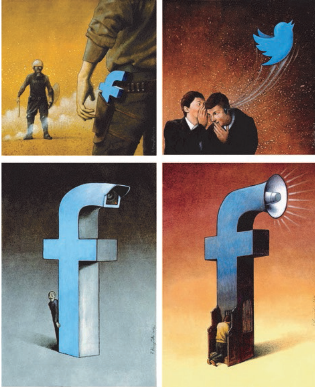
Figura 2: Ilustrações críticas de Pawel Kuczynski.