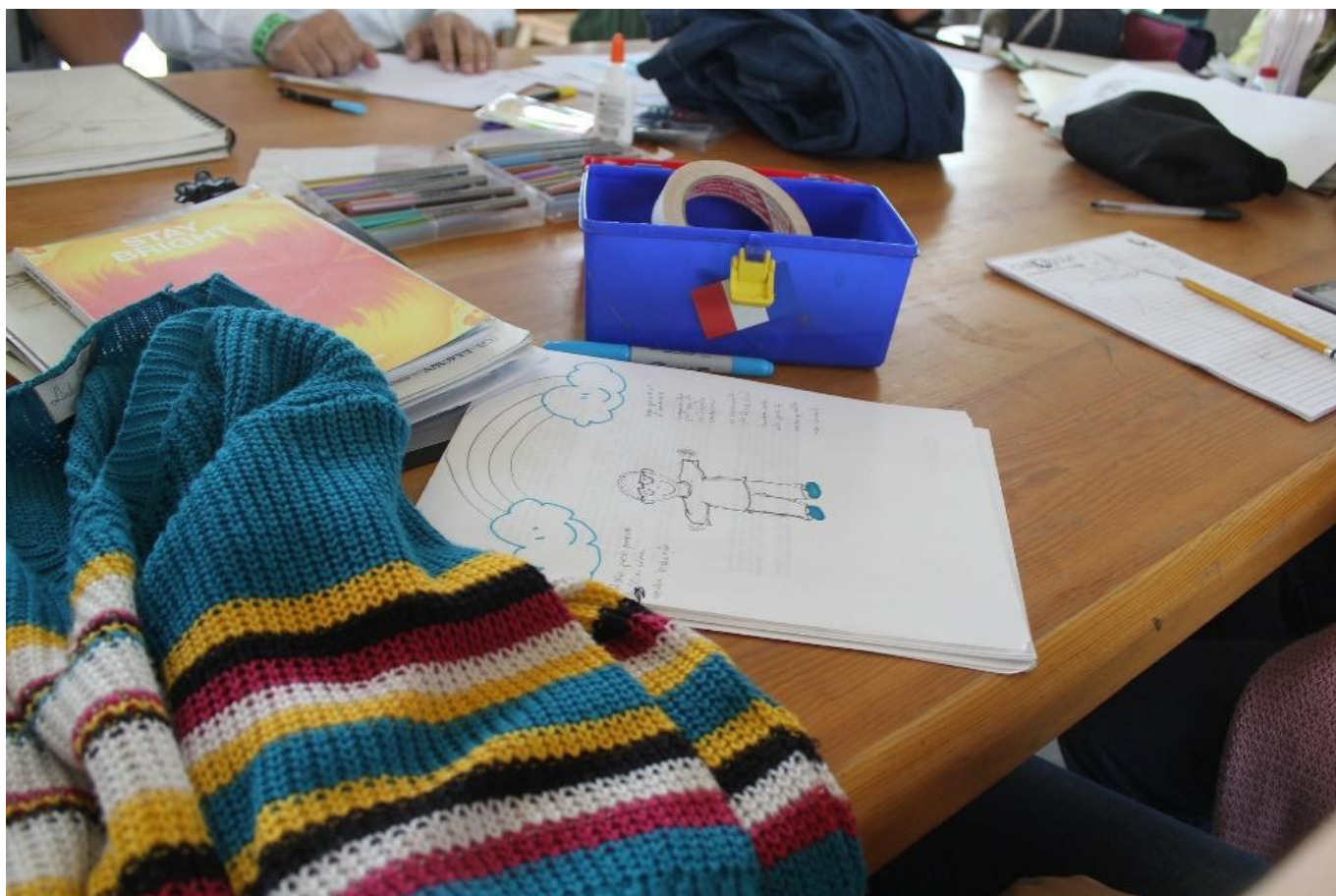
Figura 6: Oficina ministrada em Maio de 2018 na Universidade Autônoma do México.

arbitrário dos africanos ocidentais aos objetos materiais. O sujeito europeu foi constituído, através da denegação do objeto" (STALLYBRASS, 2012, p.42), do restauro desse fetiche relativo ao amor e ao trabalho, reconhecendo que os objetos têm vida e fazem parte ativamente da nossa construção social. Ou seja, do reconhecimento de que roupas/objetos não são meras coisas, mas que possuem uma vida social e afetiva, carregando memórias e valores agregados muito além dos da mercadoria, de modo a fazer repensar o fetiche a partir da magia das coisas e não do lugar de objetificação.