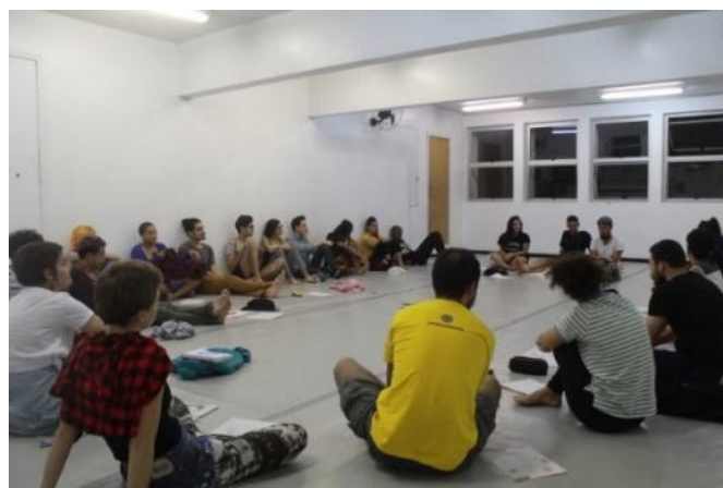
Figura 3: Oficinas ministradas em Março de 2019 na Fundação Clóvis Salgado _MG.