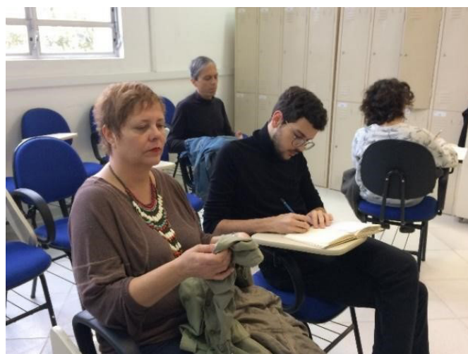
Figura 2: Oficina ministrada em Setembro de 2018 na Universidade do Estado de Santa Catarina.