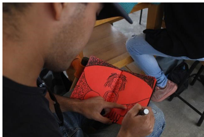
Figura 1: Oficina ministrada em Maio de 2018 na Universidade Autônoma do México .Fonte: Autor

anteriores à experiência, segundo a autora, nos configuramos sempre a partir do encontro. Assim, nas palavras da autora: "Na minha elaboração realista agencial, os fenômenos não marcam meramente a inseparabilidade epistemológica do observador e observado, ou os resultados das medições; ao contrário, os fenômenos são a inseparabilidade ontológica de componentes agencialmente intra-ativos." (2007, p.139, Tradução Nossa do original "In my agential realist elaboration, phenomena do not merely mark the epistemological inseparability of observer and observed, or the results of measurements; rather, phenomena are the ontological inseparability 1 entanglement of intraacting "agencies."").