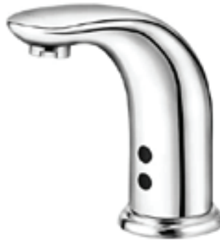
Figura 2. Torneira automática DocolTronic Zenit.

operar não permite o controle de vazão ou temperatura. A experiência de escovar os dentes utilizando este tipo de torneira é, por vezes, bastante desagradável, visto que a aproximação da escova de dente nem sempre é suficiente para acioná-la.