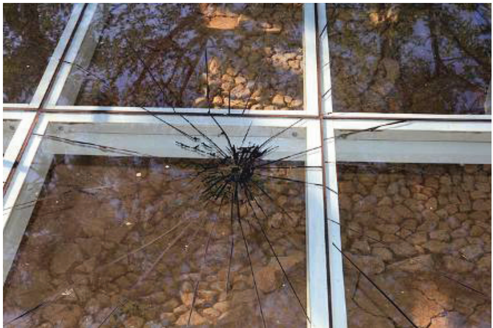
Imagem 1. Detalhe: intervenção urbana do artista Cristian Segura realizada na Praça Tiradentes, durante a 6ª VentoSul – Bienal de Curitiba, 2011

Essa pavimentação foi descoberta em 2008, e o seu centro possui uma Araucária, símbolo da cidade. Mas quem se importa com um chão todo ressecado e rachado num lugar onde não podemos nem mais pisar, somente observar à distância? A própria cidade se esqueceu desse espaço, e ela se reconstrói a cada momento, não pára, passa por cima do velho, derrubando e erguendo um novo. A cidade é uma constante ruína que se reconstrói e se destrói, e o artista nos faz acreditar que, através de pequenos dispositivos, aquele lugar realmente está desmoronando.