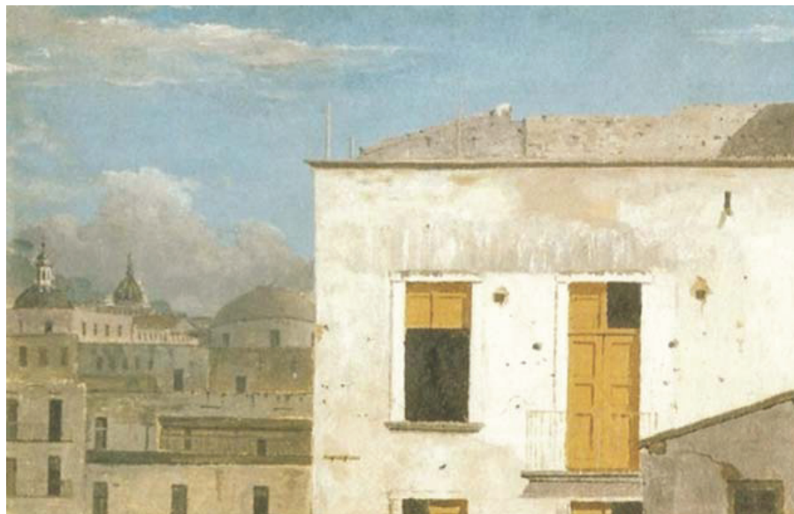
Imagem 2. Thomas Jones, Edifícios de Nápoles , 1782, óleo sobre papel, 14,2 x 21,6 cm. National Museum and Galleries of Wales, Cardiff

No Jardim Botânico (Imagem 3), uma estufa com estrutura metálica revestida com vidro, guarda várias espécies botânicas que são referências nacionais. Não há mais as rachaduras no vidro como na Praça Tiradentes e sim, o som que as ocasionou, ou melhor, as palavras que evocam esse som. Nessa intervenção, palavra e arquitetura brigam por espaço, e não há como passar despercebido, pois o Jardim Botânico racha na nossa frente.