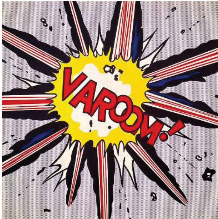
Imagem 8. Roy Lichtenstein, Varoom! , 1962, magna sobre tela, 142 x 142 cm. Estate of Roy Lichtenstein. Ryobi Foundation

Se nas intervenções urbanas de Cristian Segura ficamos apreensivos quanto à estrutura frágil, nos quadros de Roy Lichtenstein temos medo desses barulhos ou de sermos o alvo dessa metralhadora ou de algo desconhecido. O teórico Klaus Honnef nos fala quanto a obra Takka Takka :