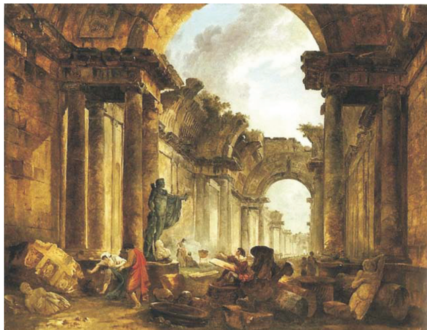
Imagem 6. Hubert Robert, Vista imaginária da Grande Galeria do Louvre em ruínas , 1796, óleo sobre tela, 115 x 145 cm. Musée du Louvre, Paris.