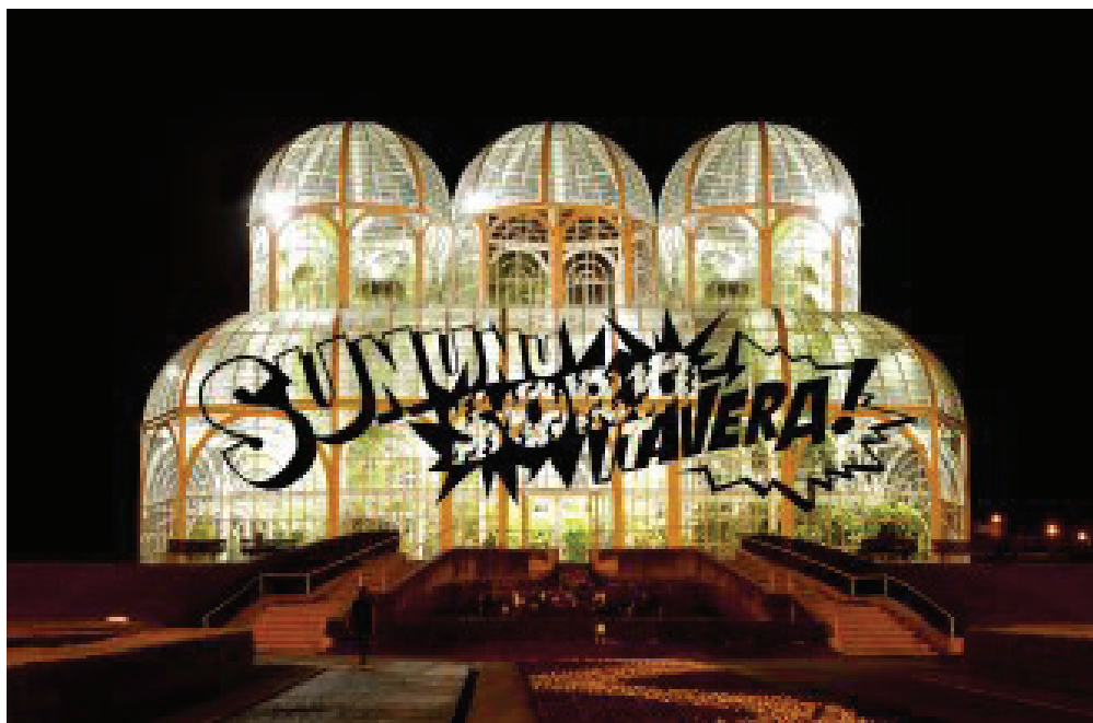
Imagem 3. Detalhe: intervenção urbana do artista Cristian Segura realizada no Jardim Botânico, durante a 6ª VentoSul – Bienal de Curitiba, 2011

No Jardim Botânico (Imagem 3), uma estufa com estrutura metálica revestida com vidro, guarda várias espécies botânicas que são referências nacionais. Não há mais as rachaduras no vidro como na Praça Tiradentes e sim, o som que as ocasionou, ou melhor, as palavras que evocam esse som. Nessa intervenção, palavra e arquitetura brigam por espaço, e não há como passar despercebido, pois o Jardim Botânico racha na nossa frente.