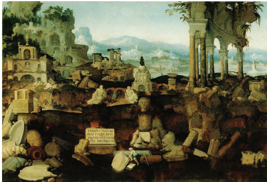
Imagem 4. Herman Posthumus, Paisagem com ruínas romanas , 1536, óleo sobre tela, 96 x 141,5 cm. Liechtenstein Museum, Vienna

(...) las pintó enfatizando lo inevitable de la ruína, arruinando aún más algunos de los pocos edificios que, en su pintura, pueden ponerse directamente en relación con los que en ese tiempo aun permanecían casi completos. (RODRÍGUEZ, 2012, p. 35)