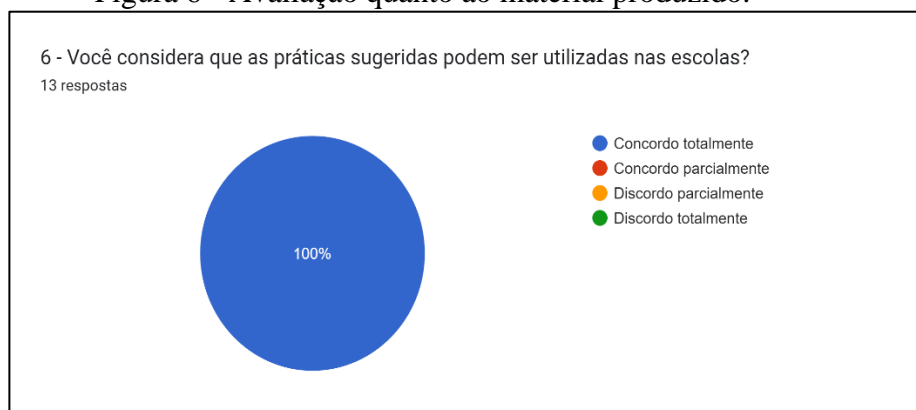
Figura 6 - Avaliação quanto ao material produzido.