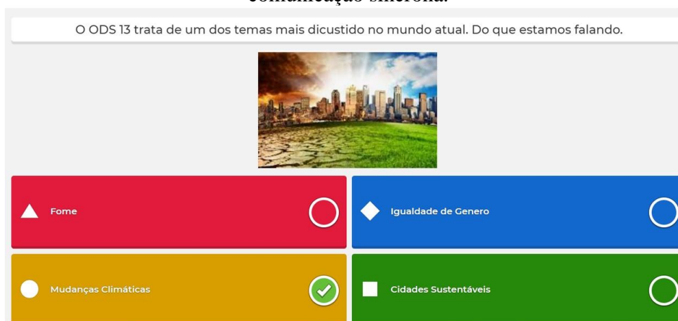
Figura 3 - Recurso didático elaborado com a ferramenta Kahoot , proposta socializada na comunicação síncrona.