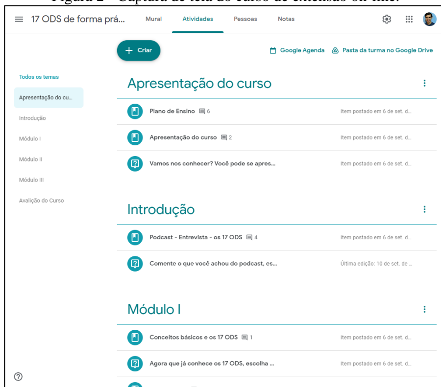
Figura 2 - Captura de tela do curso de extensão on-line.