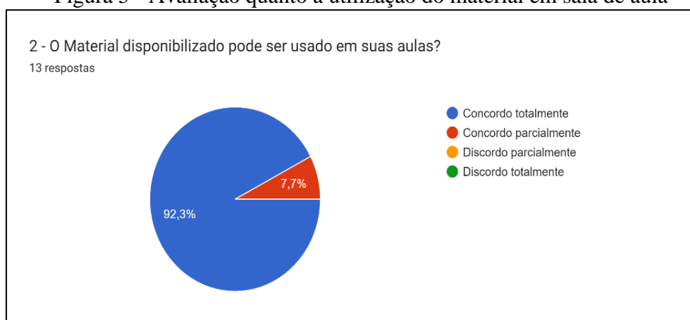
Figura 5 - Avaliação quanto a utilização do material em sala de aula