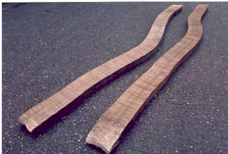
Imagem 4. Jac Leirner. Os cem , 1987. Cédulas perfuradas e unidas por cabo de aço inoxidável, 300 x 0,15 x 0,7 cm. Coleção l’Huillier, Genebra. © Rômulo Fialdini. Disponível em: http://www.brasilartesciclopedias.com.br/nacional/leirner_jac.htm . Acesso em: 15 de jul. de 2016.

que ela produz com estes objetos: acumular e organizar. Ao recolher uma quantidade de material, a artista procede com uma operação de organização (é o caso dos trabalhos das imagens 1 e 4, papéis de cigarro e cédulas). O que acarreta um gesto quase burocrático, um procedimento padrão em lidar com os objetos banais que resulta, porém, “como o ato de produzir uma alteração e suspender o estabelecido” (CHEREM, 2012. p. 26). Característica situada na antípoda das convenções dadaístas de Marcel Duchamp e o uso do ready-made.