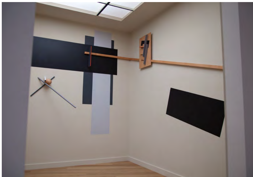
Imagem 2. El Lissitzky, Sala Proun , 1923e reconstrução em 1965. Materiais diversos, 300 x 300 x 260 cm. Disponível em: http://www.stedelijk.nl/en/collection/collection-online#/lissitzky . Acesso em: 1º de abr. 2016.

A redução dos elementos, a escolha pelas formas geométricas e o distanciamento para um espaço não correspondente aquele da representação figurada são as características que ligam os trabalhos de El Lissitzky, aos Crossings Colors (imagem 3) de Jac Leirner. As cinco peças de madeira se encaixam em forma de cruz e estão dispostas uma após a outra no chão. Cada peça é composta de duas hastes de madeira e cada uma delas é pintada com cores intensas e de aspecto industrial, em ambas as faces e também nas extremidades da peça. A combinação de cores é casual e não respeita nenhuma hierarquia de ordem cromática ou tonal. O conjunto marca esta ligação das formas geométricas flutuando independentemente do fundo, ou da superfície na qual se apoiam. Percebe-se na imagem a dinâmica formal irreverente que não respeita a gravidade e que aproxima estas esculturas em direção à conquista do espaço de representação que propuseram os artistas suprematistas.