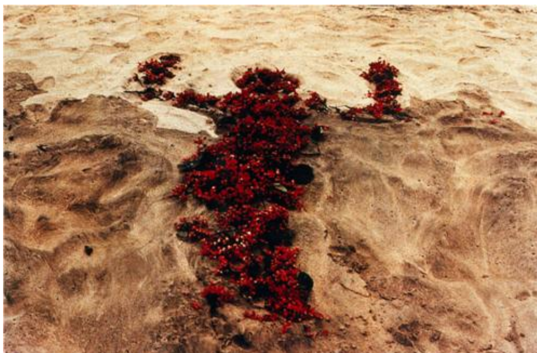
Figura 2 – Ana Mendieta, Silhueta Series , México, 1978

I didn't have a dark side because the darkest of me was expelled. I left marks in rivers, on rocks, on leaves, and on both, the shores of my adopted land and my beloved island. I wanted to be an island, and island I was in the mix of the four elements. My figure, shaped in the sand, remained for a while. After so many waves it vanished to disappear. But if you looked at me and you open yourself to me, I'll exist yet in another time. iv