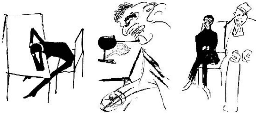
Figura 4 – Desenhos de Franz Kafka, 1921