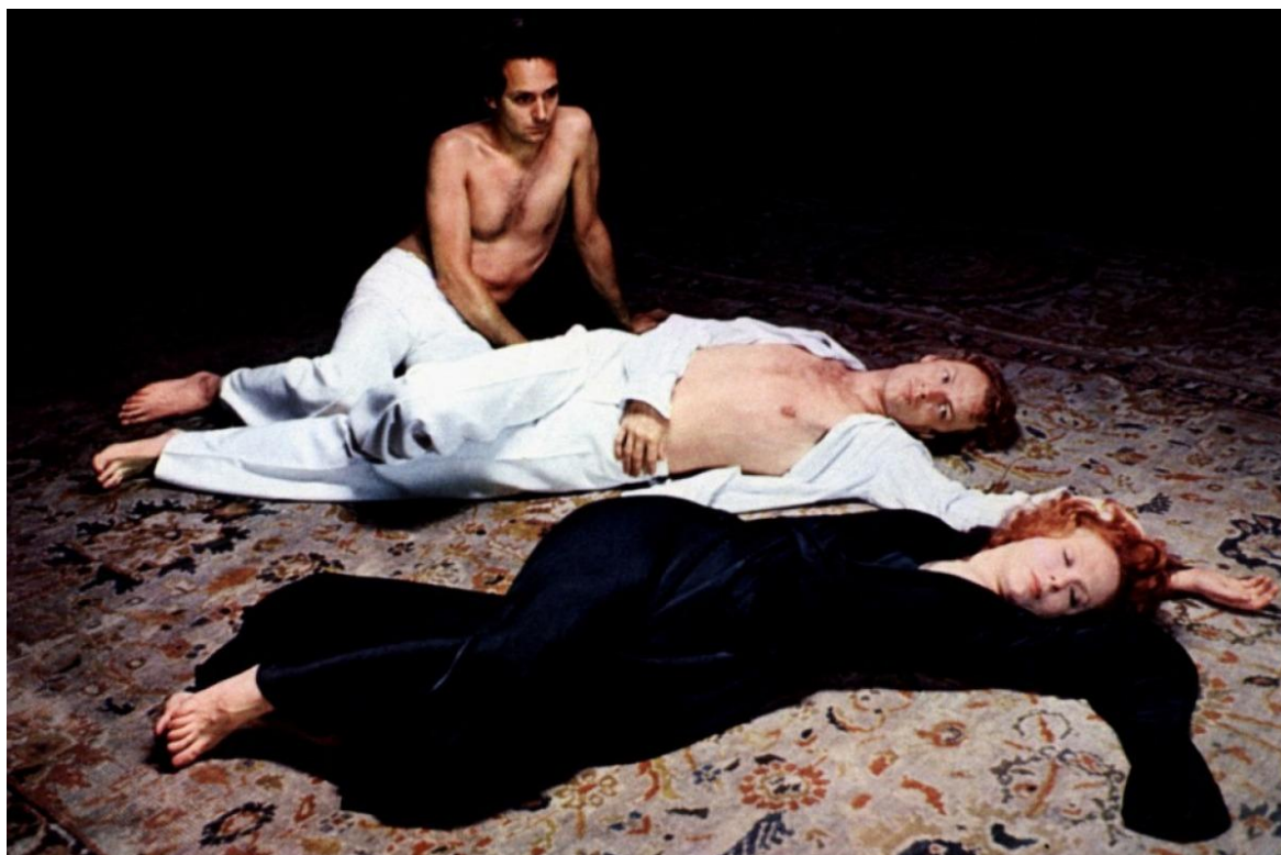
Figura 1- Marguerite Duras, frame do filme India Song , 1975

Mas então que “natureza” faria o corpo humano produtor da arte e da escrita para continuar se produzindo e se modificando? O impulso de escrever como se fosse regido por uma espécie de lei natural parece uma necessidade do corpo de inscrever-se no mundo, de assegurar-se no mundo real, e não uma escapatória a ele – como a arte e a escrita, em geral, foram lidas ao longo da história. Ainda em A Anti-Natureza , Clément Rosset afirma “que los menos artificialistas de los artistas sean precisamente aquellos que se confían con la mayor insistencia al artificio, en cual ven un refugio contra la naturaleza y una escapatoria a lo real”. (ROSSET, Clément. La Antinaturalaleza . p. 13)