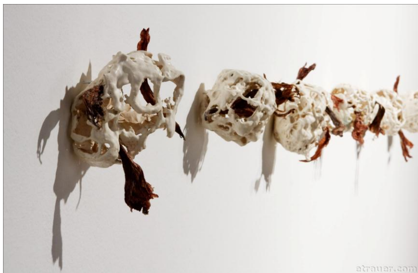
Figura 2. Betânia Silveira. Série Quiasma. O que nos perpassa nos constitui . 2009. Cerâmica e flores secas.

da planta que um dia foi vermelha e agora permanece seca entre a cerâmica tornando-se marrom em O que nos perpassa nos constitui .