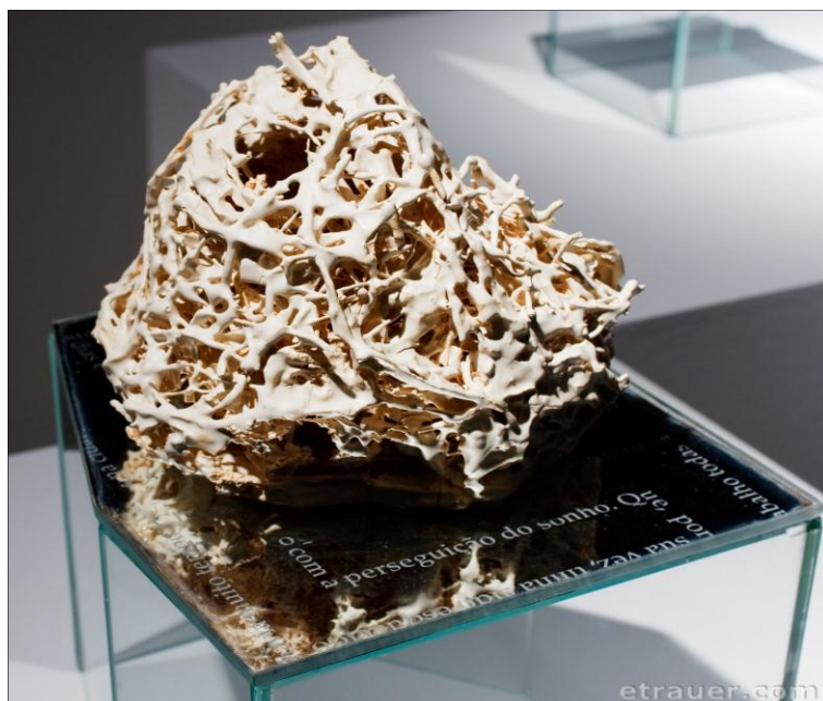
Figura 3. Betânia Silveira. Série Quiasma. Ítalo, Valeska, o Pássaro e Eu . 2009. Cerâmica, redoma de vidro, espelho.