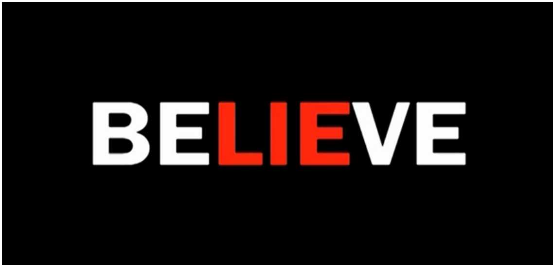
Figura 1. Slide 1 que aparecia nos telões dos shows da banda U2 no decorrer da execução da música The Fly durante a turnê Zoo TV , entre os anos de 1992 e 1993.

A palavra inglesa believe presente na figura que inicia esse texto significa, em tradução livre para o português, “acredite”. Destacado em vermelho no centro da imagem está a sílaba lie que pode ser traduzido como ‘mentira’. Tal imagem é emblemática no que concerne a discussão acerca da concepção de realidade que construímos a partir da linguagem e, no caso específico desse trabalho, a partir da linguagem visual. O poeta Octavio Paz relata que “a primeira atitude do homem diante da linguagem foi de confiança: o signo e o objeto representado eram a mesma coisa. [...] Porém, ao cabo dos séculos, os homens perceberam que entre as coisas e seus nomes abria-se um abismo” (Paz, 1982, p. 35). Como se sabe, os signos precisam que ‘acreditemos’ neles para que façam sentido; e, não raramente, quando depositamos neles nossa crença, acabamos esquecendo que em seu seio repousa uma ‘mentira’, ou – evitando o sentido pejorativo do termo – uma ficção, um conjunto de convenções criadas por homens. Acerca dessa instabilidade da linguagem, os pesquisadores Eugênio Bucci e Maria Rita Kehl nos dizem: