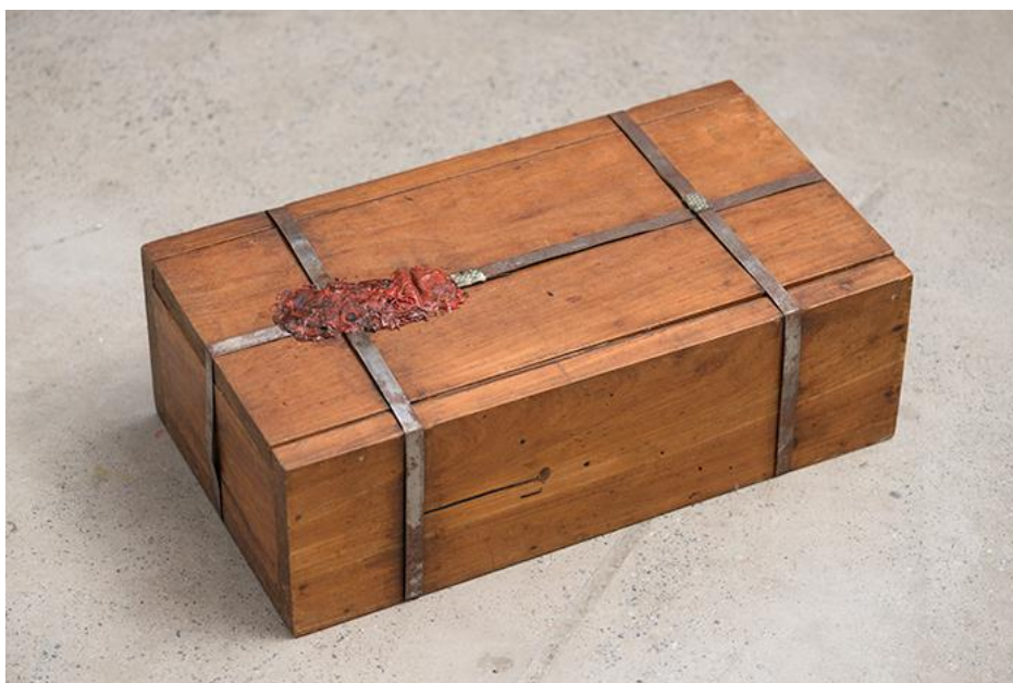
Figura 2. "Urnas Quentes" (1968), de Antonio Manuel.

Estas caixas eram a proposta artística de Antonio Manuel: as Urnas Quentes . Quentes porque urgentes, Urnas com seu duplo sentido de ou funerária ou eleitoral.