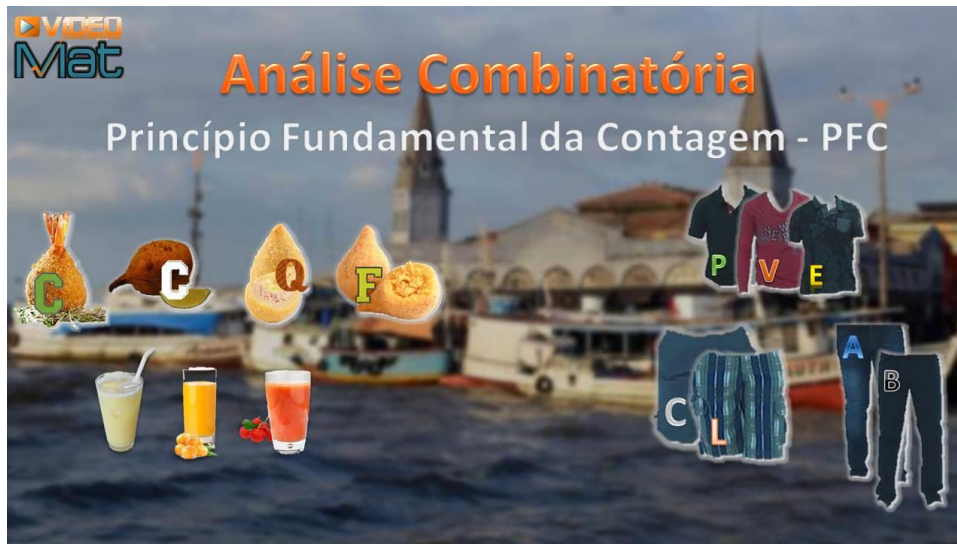
Figura 8: tela inicial da videoaula

paraenses, expressam a diversidade rítmica do estado. O vídeo completo tem duração de 7 minutos e 27 segundos. A seguir, apresentaremos a tela inicial e a ficha técnica da videoaula produzida neste estudo (Figura 8).