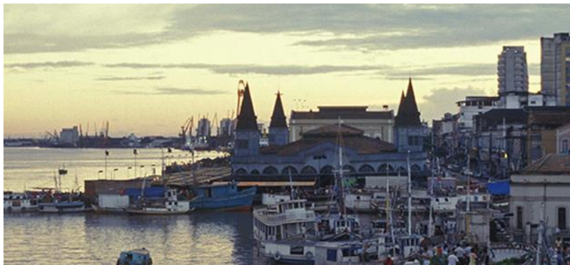
Figura 1: Ver-o-Peso

Decidimos gravar no Ver-o-Peso, cartão postal de Belém e considerada a maior feira a céu aberto da América Latina. É um lugar de intensa vida social e intercâmbio cultural, onde práticas trabalhistas tradicionais ocorrem e uma complexa teia de relações sociais é tecida. Essas relações envolvem não apenas o comércio de natureza comercial, mas também simbólica (IPHAN, 2018), como ilustrado na figura 1: