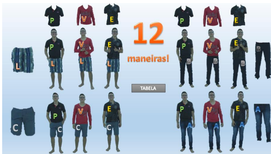
Figura 7: Segunda parte explanatória do vídeo

Analogamente, no segundo problema (Figura 7), foram apresentadas três formas de resolução: árvore de possibilidades, tabela e PFC. Essas abordagens ressaltaram o princípio aditivo, associado ao conectivo “ou”, e o princípio multiplicativo, relacionado ao conectivo “e”.