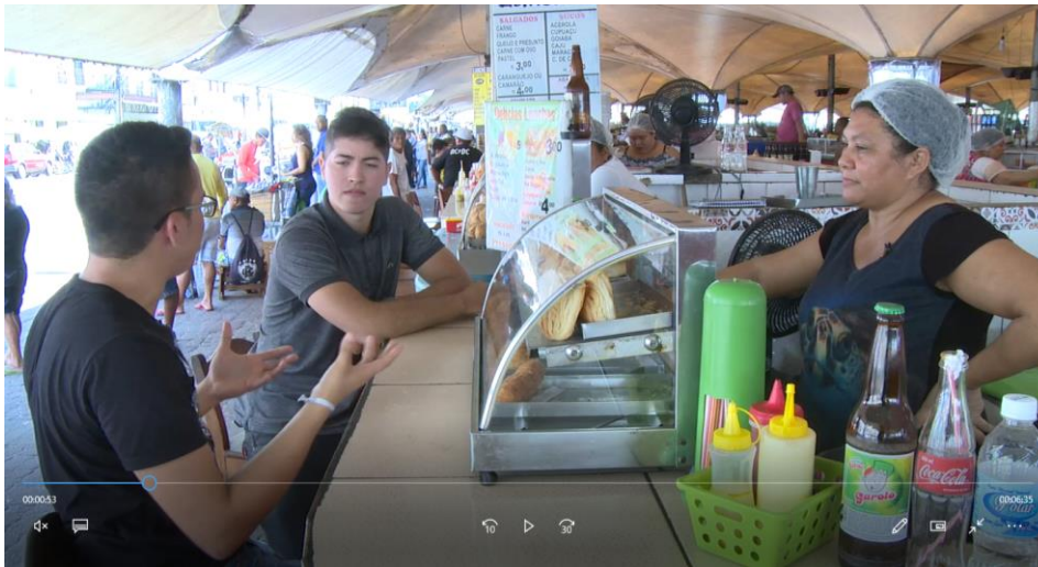
Figura 3: primeira situação problema do vídeo