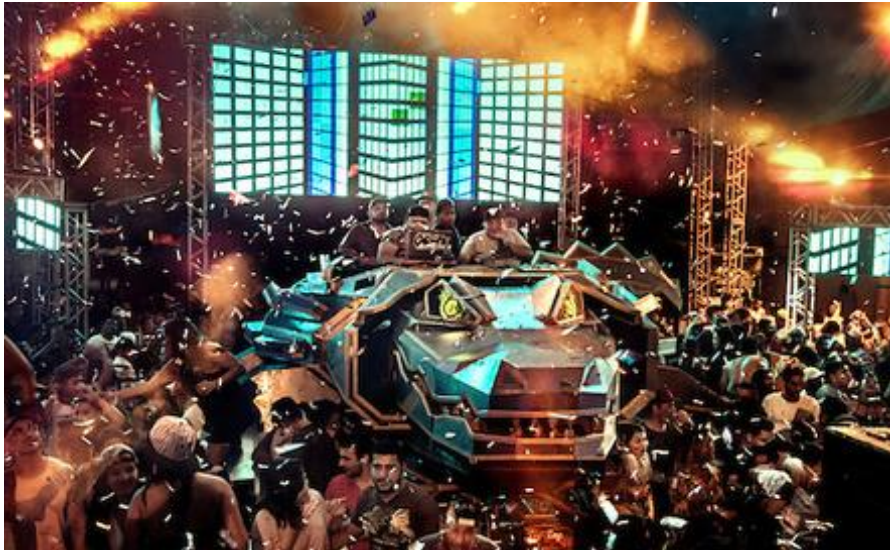
Figura 5: Aparelhagem Crocodilo (Gigante Crocodilo Prime)

tecnomelody (ou tecnobrega), gênero musical popular originado em Belém do Pará e reconhecido como patrimônio imaterial artístico e cultural do estado (FERNANDES, 2021).