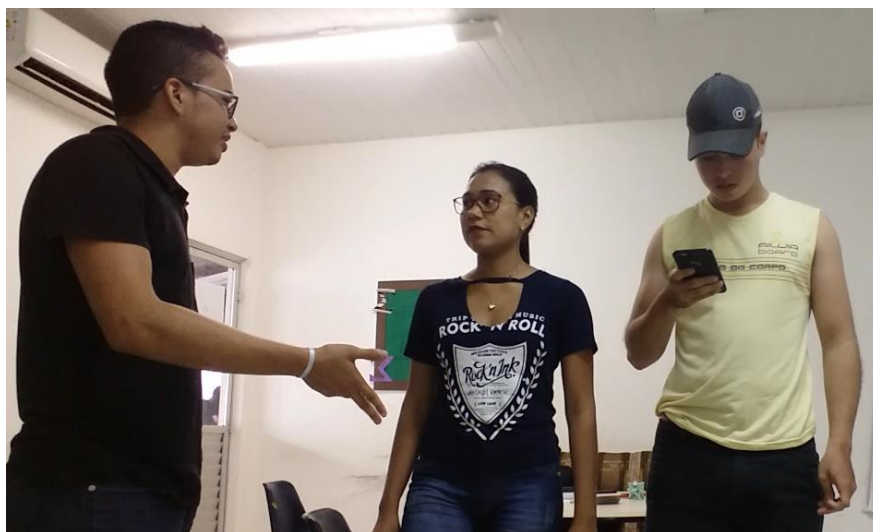
Figura 2: ensaios para a gravação