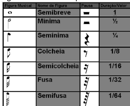
Figura 1 – Tabela de equivalência entre notas e frações

A segunda relação feita entre música e matemática diz respeito ao ensino das operações entre frações a partir das figuras que representam os tempos das notas musicais. Como no quadro a seguir, retirado de um dos trabalhos analisados, observamos que cada figura musical e respectivamente a figura de pausa, possuem um valor: