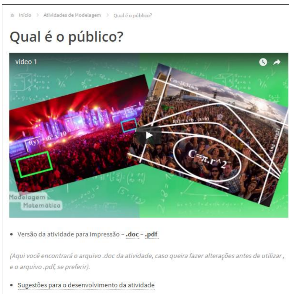
Figura 6 – Parte do blog referente à atividade: Qual é o público (Produto Educacional) Fonte: modelagemmatematica.wordpress.com. Acesso em: 10/01/2018.