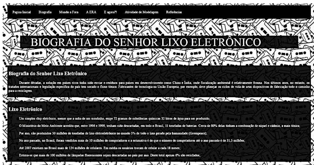
Figura 3 - Página inicial do site de uma dupla de alunos

As atividades de Modelagem Matemática, bem como a descrição de algumas das resoluções dos alunos e sugestões de encaminhamento para a sala de aula, estão disponíveis no Blog de Modelagem Matemática (Figura 4). Este, por sua vez, tem a pretensão de servir como apoio ao professor que se interessar em trabalhar com Modelagem.