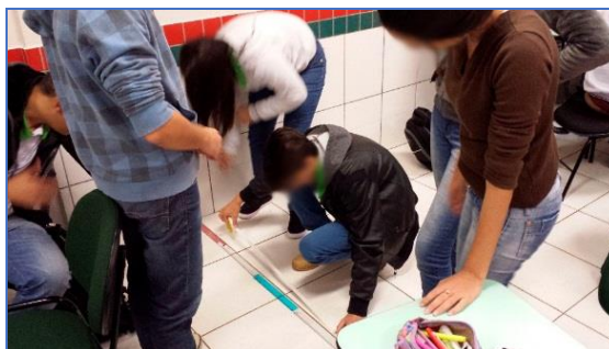
Figura 1 - Alunos medindo os segmentos para formar a região quadrada de 1 metro de lado, com vistas a estimar quantas pessoas cabem em 1 metro quadrado

A atividade “Qual é o público?” surgiu de um contexto do livro de Malba Tahan, O homem que Calculava. A partir de um trecho do livro, onde o calculista determina a quantidade de folhas de uma árvore, levantou-se uma discussão sobre a aglomeração de pessoas em locais públicos, como shows e passeatas. Deste modo, a partir da foto de um show da cidade onde se localiza o campus do Instituto, os alunos tinham o objetivo de estimar a quantidade de pessoas presentes no local.