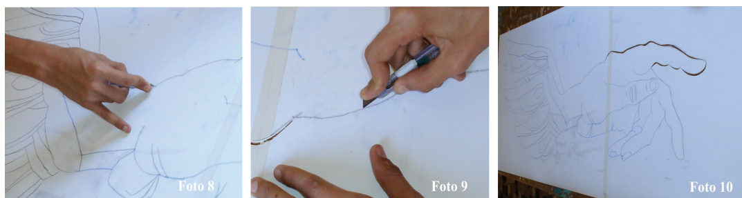
Fotos 8, 9 e 10 – Adolescente recortando o molde vazado ou estêncil com estilete.