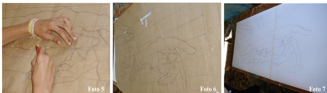
Fotos 5, 6 e 7 – Ampliação do desenho escolhido e transferência para papel duplex 250grs.