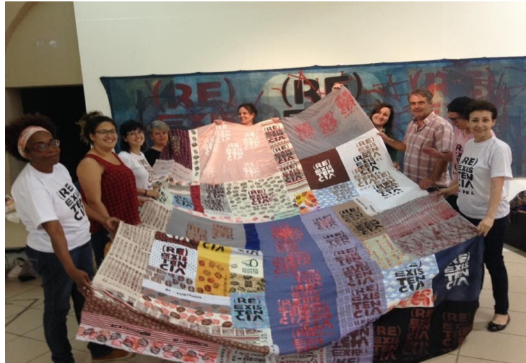
Figura 4: Ação Coletiva (RE)EXISTÊNCIA, Pelotas, 2016.

Precisamos ser ativadores de novos espaços de criação e estimuladores da educação para que surjam sempre novos docentes. Também é preciso sermos capazes de sensibilizar para os temas atuais e urgentes: violência de gênero, racismo, desigualdade social, multiculturalidade, meio ambiente. É com a pluralidade, compartilhando conhecimento que podemos recuperar o humanismo que nos forja sob o princípio da igualdade e respeito aos direitos humanos. As ações propositivas que experimentamos instauram rupturas porque implicam em outros modos de ver, para olhar a si mesmo e perceber o outro. É preciso aprender a vermo-nos como sociedade, pertencentes a um mesmo mundo e compartilhando das mesmas necessidades de vida e de felicidade. Em tempos de crise e obscuridade é preciso trazer a arte, acionando seu viés mais político, pelo desassossego que provoca, abalando convicções para fazer aflorar pensamento crítico e fruição em perspectiva ampliada, inclusiva e cidadã. Sejamos (RE)EXISTÊNCIA como afirmam nossos autores referentes e insurgentes (Figura 5).