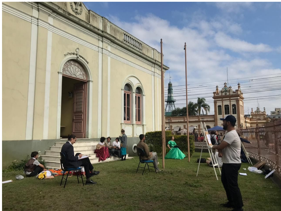
Figura 3: Ação Performática no MALG, Pelotas. Fonte: Autoras.

possam perceber e reconhecer que representações, apresentações, manifestações e situações desencadeiam significados e sentidos que são atravessados pelas relações de poder. As ações têm possibilitado estabelecer conexões que extrapolam temporalidades, culturas e geografias, conjugam poesia, didatismo e ativismo político