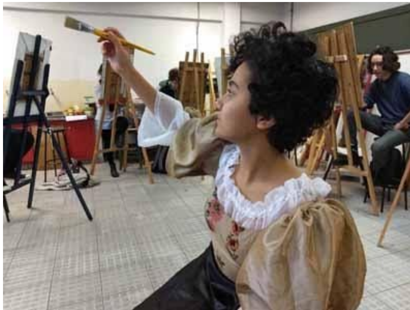
Figura 2: Aluna caracterizada como Artemísia Gentileschi em aula de desenho.

no enfrentamento das dificuldades, a generosidade na partilha de saberes, a curiosidade e bravura para experimentar o novo, romper com tradições e serem exemplos para nós que as sucedemos (Figura 2).