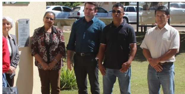
Figura 8 - Representantes das etnias: portuguesa, quilombola, indígena e japonesa Inauguração do Mural: 22/03/2017

situado”, na visão de Ferrando (2012, s/p) “a prática pós-humana da constante reformulação simbólica humana, que se propõe não resolver no coletivo a perspectiva individual, mas que a reconheça em um pluralismo situado e não disciplinável”. Essa possibilidade de refletir e atuar a partir do “inclusivismo situado”, deu-se na composição do mural, no diálogo com as etnias formadoras do município de Palmas, nas entrevistas realizadas com os representantes dessas etnias e no ato de inauguração da obra, quando a maioria desses grupos étnicos se fez presente (Figura 8 e 9).