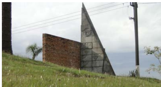
Figura 6 - Obra de Poty Lazarotto- Gravuras em concreto sobre a história de Palmas Arquivo Projeto Muralismo

E, no ano de 2015, foi inaugurado uma homenagem aos índios de Palmas no Parque da Gruta (Fig. 7), localizado no interior deste Parque, com menos visibilidade do que os monumentos anteriores.