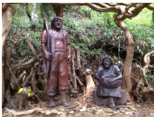
Fig.7 – Homenagens aos índios – Parque da Gruta (Palmas, PR) – 2015 Artista: Itacir Bortoloso

Como visualizado nas fotografias, a presença das etnias que fazem parte desta cidade possuem visibilidade parcial, ou seja, brancos tropeiros e brancos europeus, excluindo quilombolas, japoneses e sírio-libaneses.