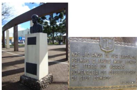
Figura 1 e 2 – Homenagem ao Dr. Bernardo Ribeiro Vianna

Na perspectiva de comprovar a rara ou nenhuma visibilidade das etnias indígena e quilombola no meio social e cultural da cidade de Palmas, apresentam-se a seguir, nas imagens, alguns monumentos que expressam o agradecimento do poder público municipal de Palmas para com os denominados “colonizadores” ou “desbravadores” dessas terras brasileiras (Figuras 1, 2, 3, 4, 5, 6) localizados em espaços de boa visibilidade. E, no ano de 2015, foi inaugurado uma homenagem aos índios de Palmas no Parque da Gruta (Fig. 7), localizado no interior deste Parque, com menos visibilidade do que os monumentos anteriores.