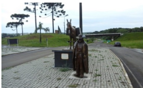
Figura 5 – Monumento aos tropeiros portugueses e paulistas – Trevo de acesso à cidade de Palmas