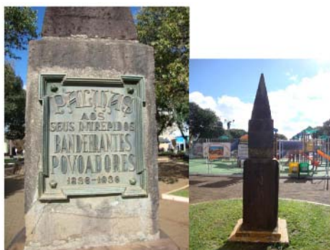
Figura 3 e 4 – Homenagem aos Bandeirantes – 1838-1936