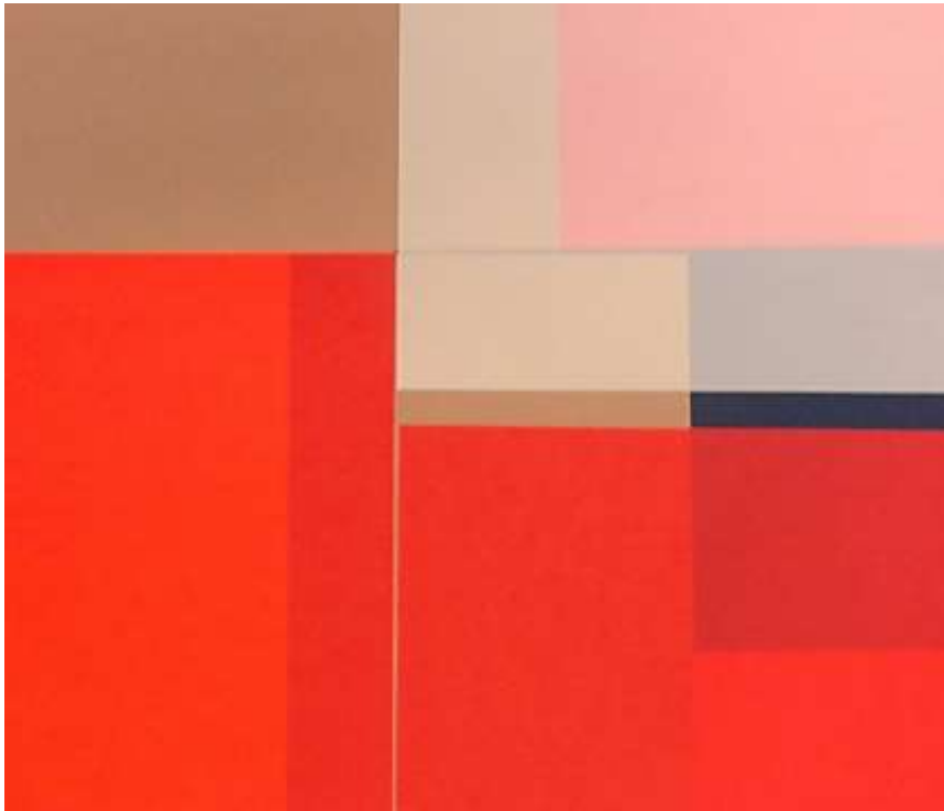
Imagem 2: Colagem.