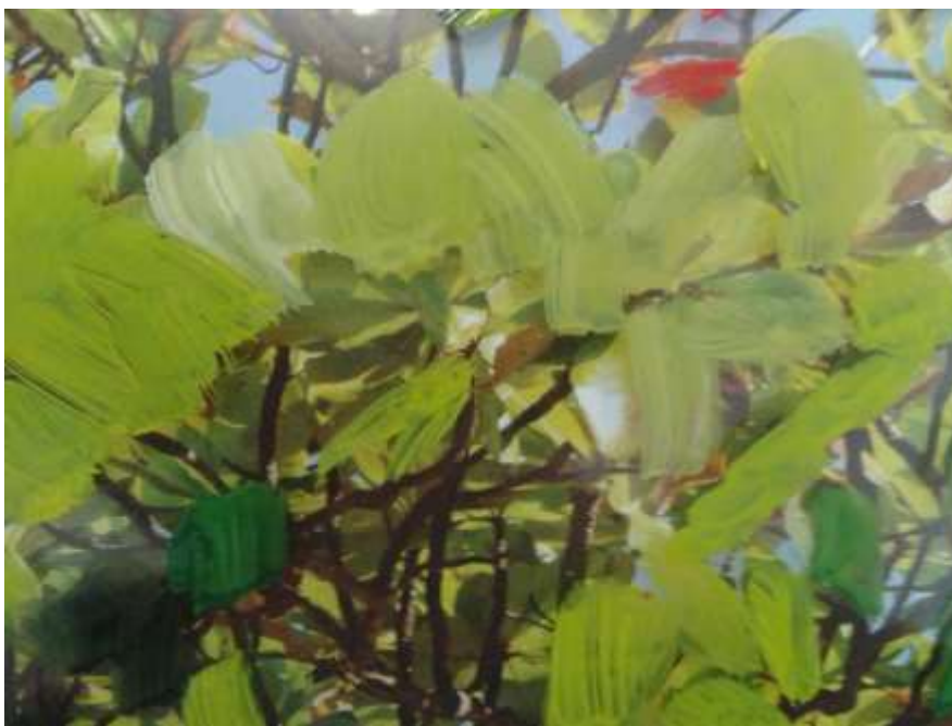
Imagem 1: Monotipia.

Fotografei para ficar com esta imagem. Era preciso continuar, testar a impressão da imagem em vários papéis. Fiz a primeira impressão em papel japonês, depois em papéis de aquarela de várias gramaturas. À cada impressão, um resultado diferente, e sempre o inverso da matriz. É possível aqui lembrar o pensamento de John Dewey a experiência, segundo o filósofo, vai de algo para algo. "À medida que uma parte leva a outra e que uma dá continuidade ao que veio antes, cada uma ganha distinção entre si."