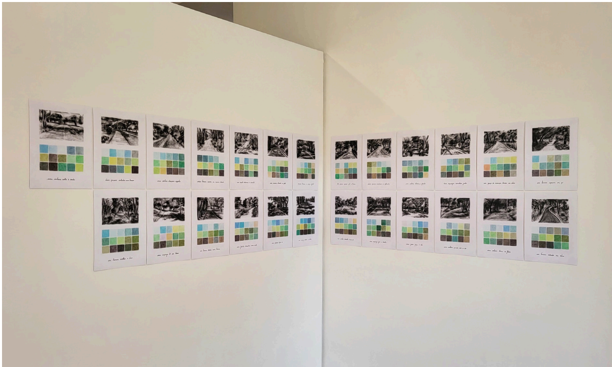
Fig. 3, Joana Paraíso, Fragmentos (série de 25 desenhos), 2024. Carvão em pó, pastel seco, tinta de arquivo e grafite sobre papel. 21 cm x 29,7 cm. COSSOUL, Lisboa.

Será através de uma relação continuada com o meio ambiente que cada indivíduo vai estabelecendo os alicerces da sua identidade, nesse sentido esta série de desenhos, que se apoia na recordação de uma experiência passada, promove um sentido de lugar, “o passado torna-se a base sobre a qual o futuro será construído, e aqueles que não honram o passado poderão nunca construir um futuro.” 5 (Solnit, 2002, p.450). A experiência de imersão nas características reminiscentes dos espaços verdes, mais do que uma simples recordação, transforma-se numa vivência intrínseca à construção da identidade pessoal e coletiva.