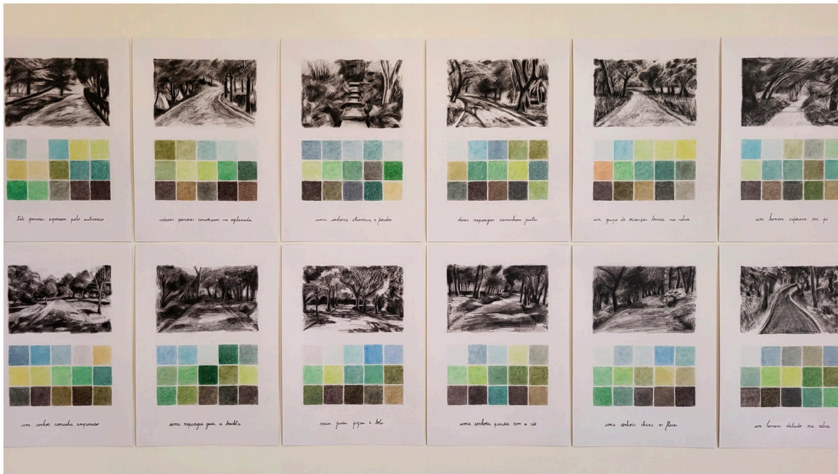
Fig. 4, Joana Oliveira, Fragmentos (pormenor) 2024. Carvão em pó, pastel seco, tinta de arquivo e grafite sobre papel. 21 cm x 29,7 cm. COSSOUL, Lisboa.

Por sua vez, a série Cruzamentos (ver Fig.5) é composta pelo conjunto de 100 desenhos, que traduzem e testemunham as decisões tomadas na passagem pelos cruzamentos das ruas encontradas ao longo do percurso efetuado. O ato de caminhar, induz-nos a tomar decisões espontâneas conforme avançamos na rota que antecipadamente traçamos e nos deparamos com os ambientes que emanam de cada rua a percorrer. Os indivíduos “na prática, continuam a tecer os seus próprios caminhos através destes ambientes, traçando percursos à medida que avançam” (Ingold, 2007, p. 75) e estabelecendo ligações entre o microcosmo pessoal e o macrocosmo público.