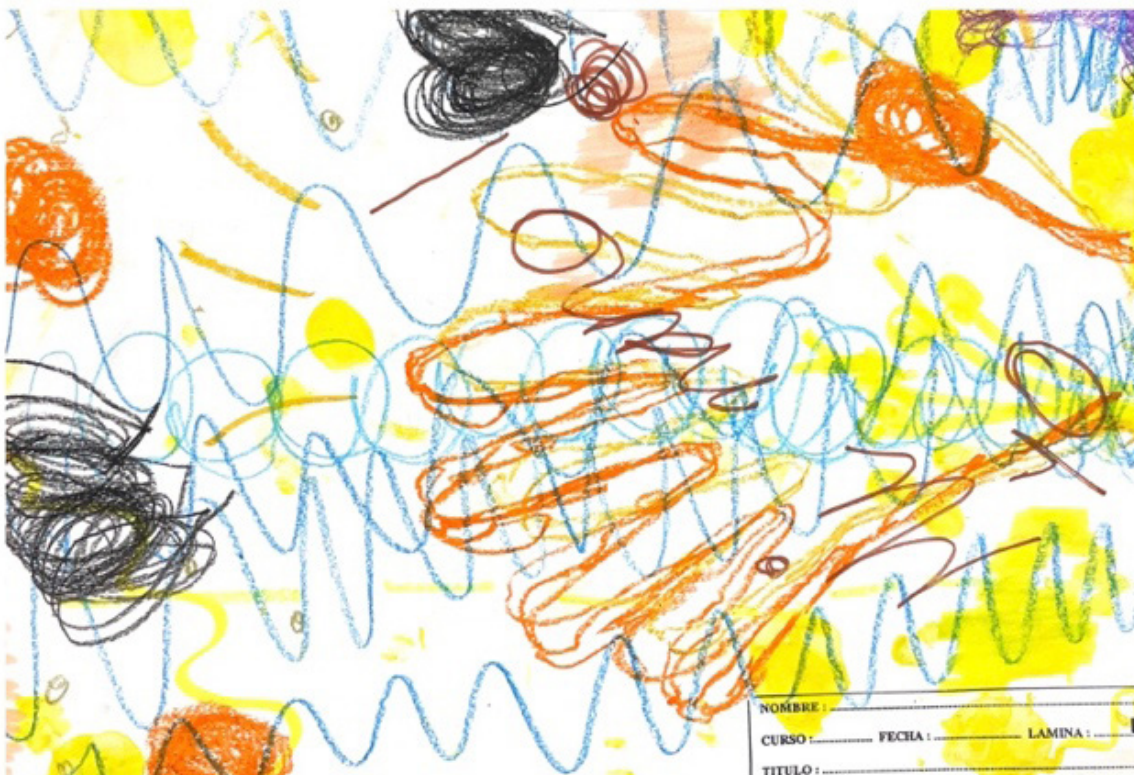
Fig. 4, Experiencias de “negar la vista” a favor del tacto, del oído y del olfato , 2022, colección autores