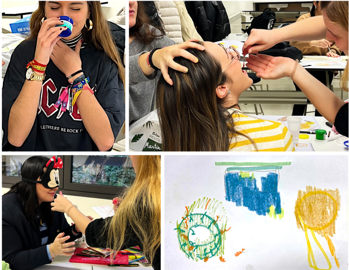
Fig. 1, Experiencia "negar la vista" a favor del olfato y el gusto, 2022, colección autores