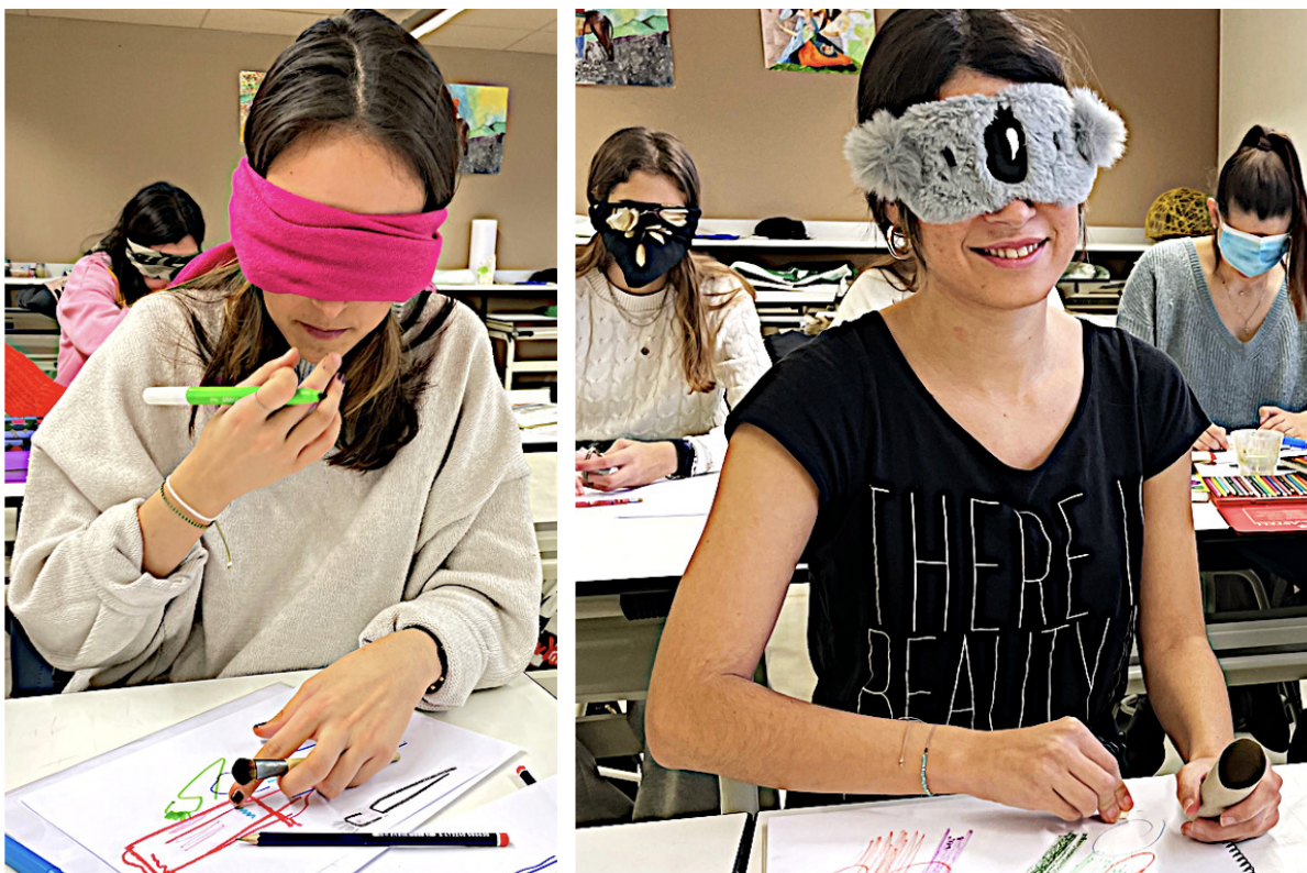
Fig. 2, Experiencia "negar la vista" a favor del gusto y el tacto, 2022, colección autores