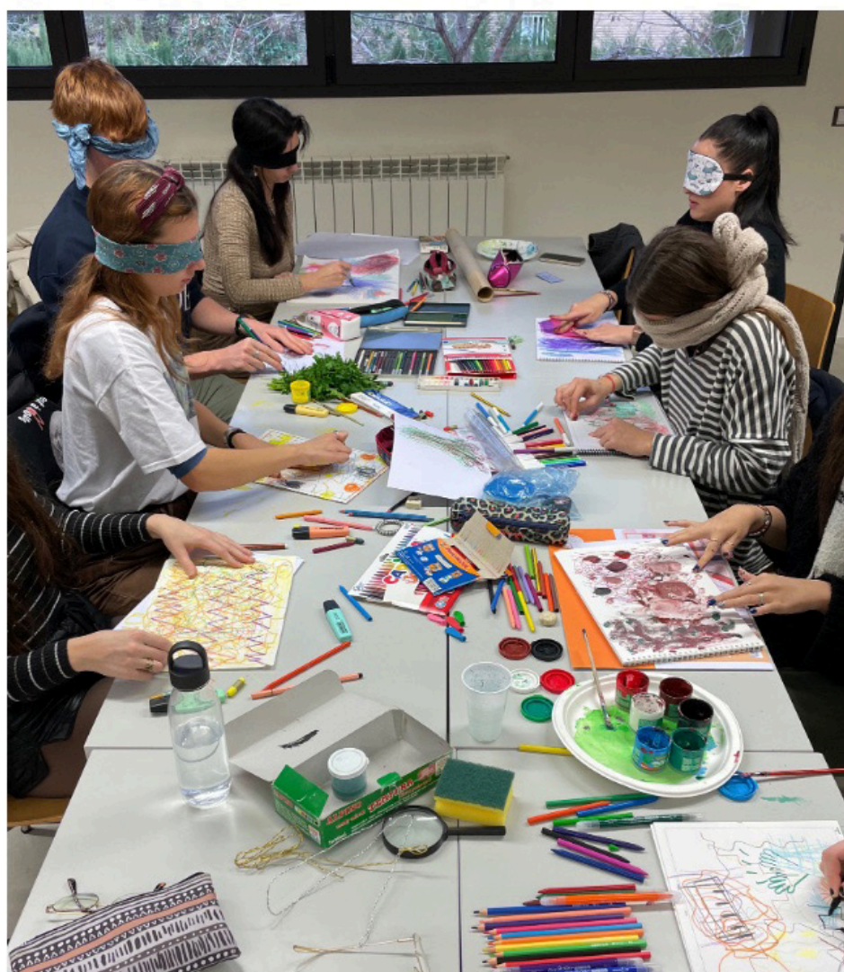
Fig. 6, Algunos resultados de "negar la vista" a favor del tacto, el gusto y el olfato, 2022, colección autores