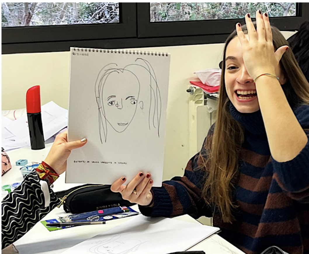
Fig. 3, Experiencia "negar la vista" a favor del tacto para hacer un retrato, 2022, colección autores