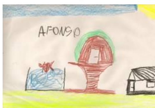
Imagem 4, 5, 6 e 7 Desenhos livres de crianças , Jardim A (2004)