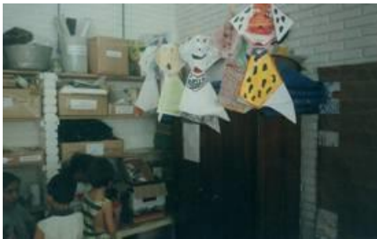
Imagem 1, 2 e 3

Acima Esquerda: “Desenho mimeografado” de uma criança de Jardim B (2004)