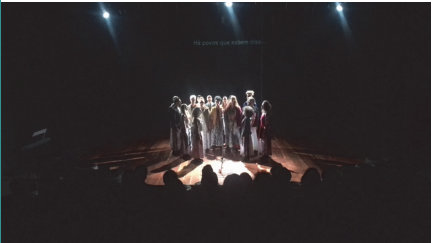
Figura 4 - Exercícios Cênicos no Teatro Laboratório da Universidade de São Paulo - USP