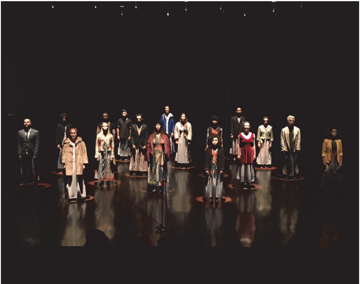
Figura 5 - Exercícios Cênicos no Teatro Laboratório da Universidade de São Paulo - USP