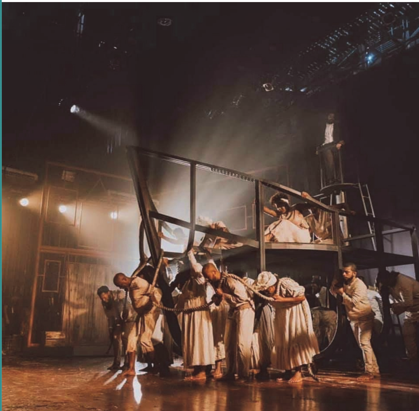
Figura 7 - Registro do espetáculo Rua Azusa o Musical

precisa entender de movimentos. Na fotografia, por exemplo, nem sempre ela é só estática, é precisa assistir muitos filmes, ter referências em arte, seja ela qual for.