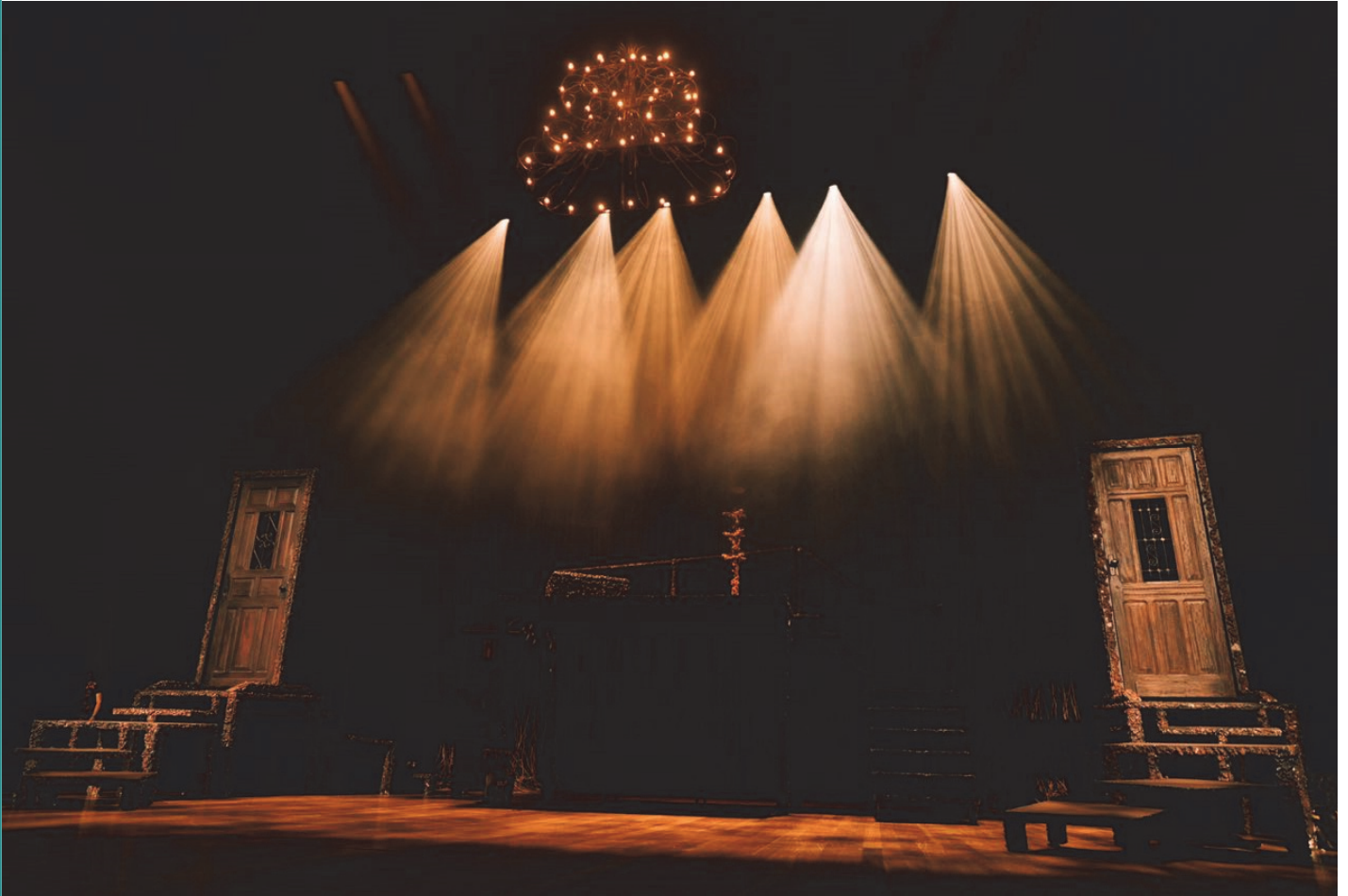
Figura 9 - Luz para fotografia de cenário da peça Jardim do Inimigo

muito mais, desde que o professor entenda que o técnico também é formador e precisa fazer parte do processo. A dificuldade ainda está nessa falta de integração e a nossa função tem alguns obstáculos ainda para vencer.