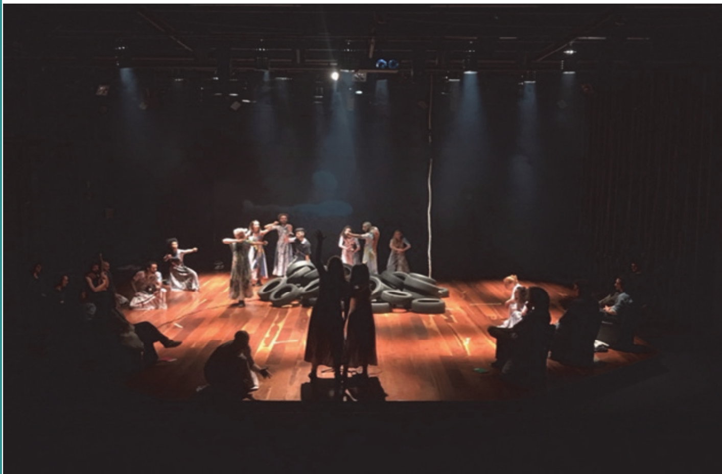
Figura 2 - Exercícios Cênicos no Teatro Laboratório da Universidade de São Paulo - USP