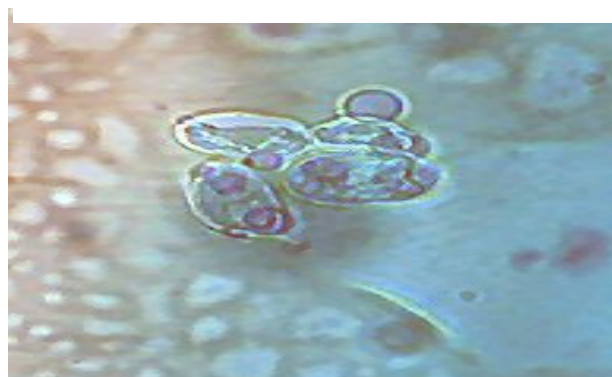
Figura 4 – Morfologia microscópica de Prototheca sp (coloração com azul de algodão).

cos envolvidos pela parede da célula-mãe (Fig. 4).