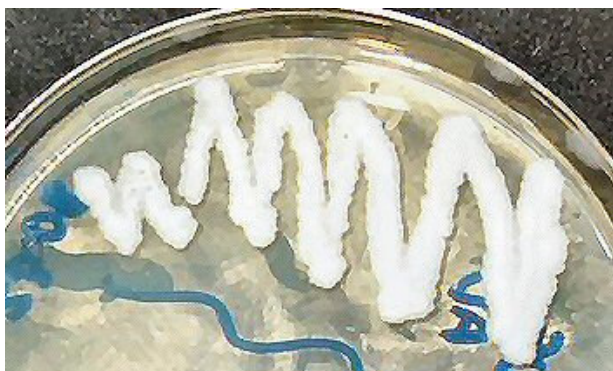
Figura 2 – Morfologia das colônias em ágar Sabouraud dextrose.