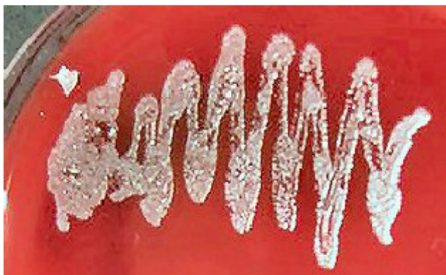
Figura 1 – Morfologia das colônias em ágar sangue.