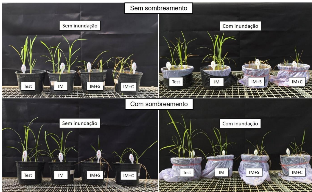
Figura 1. Fitotoxicidade em plantas de arroz irrigado em função do herbicida, inundação do solo e sombreamento aos 7 DAA. Lages, SC, 2019.

Esses resultados corroboram com o que foi descrito por HELGUEIRA et al. (2017), onde aos 21 DAA, as plantas de arroz se recuperaram das injúrias provocadas pelos herbicidas, independentemente do manejo de água adotado.