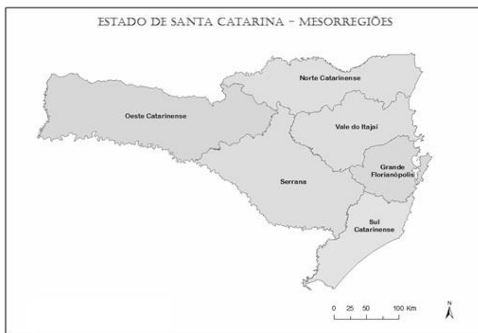
Figura 1 - Mesorregiões do Estado de Santa Catarina.

Para a estimativa da produção de resíduos da cultura do milho, o coeficiente técnico apresentado na Tabela 1 foi utilizado, obtendo-se 7.176.125 toneladas de palhada e 1.722.270 toneladas de sabugo, totalizando 8.898.395 toneladas de resíduos resultantes da cultura e processamento do milho em Santa Catarina.