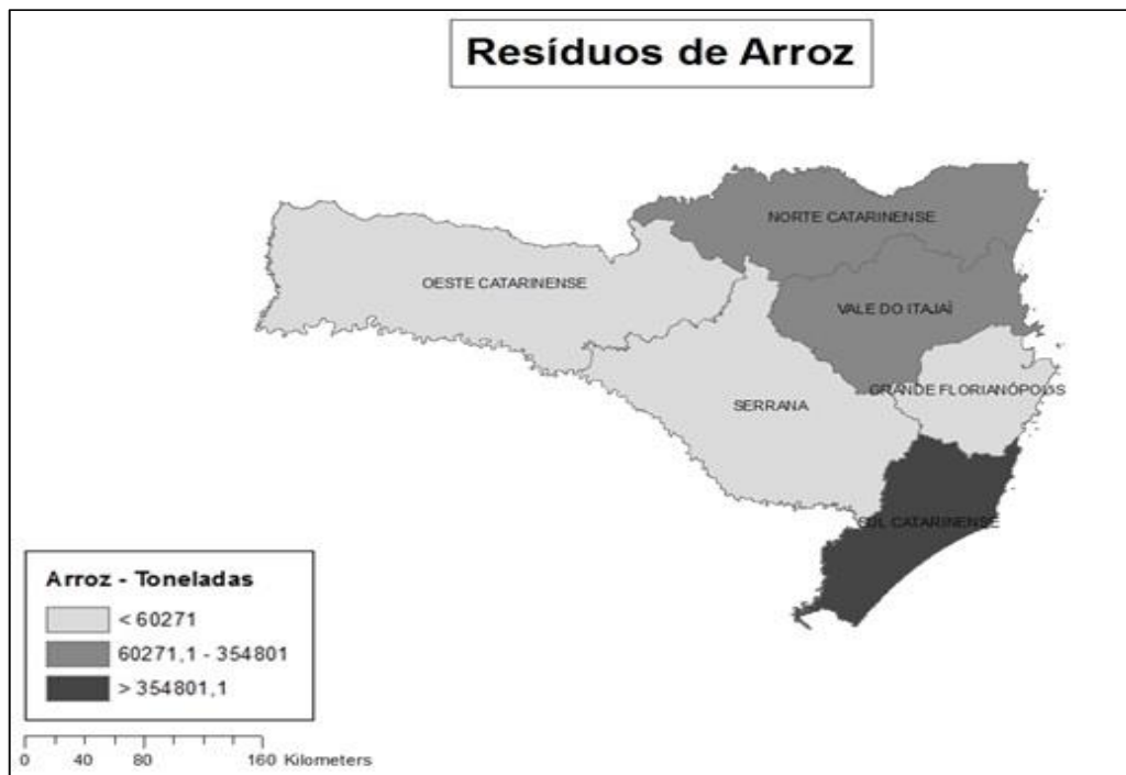
Figura 4 - Mapa ilustrando a disposição dos resíduos da produção de arroz nas mesorregiões de Santa Catarina. Figure 4 - Map illustrating the distribution of rice residues in the mesoregions of Santa Catarina.

Após a queima da casca nas caldeiras, é gerado um subproduto, denominado cinza de casca de arroz. Até o momento, não existem estudos usando este resíduo para a geração de energia, seu uso está basicamente relacionado ao teor de sílica. Segundo DELLA et al. (2001), este subproduto é rico em sílica