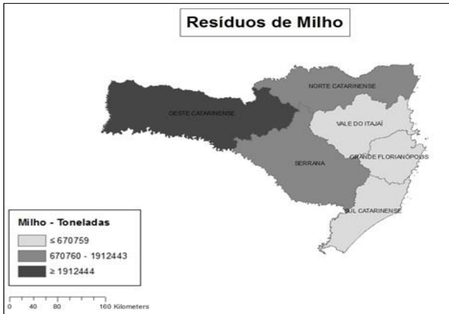
Figura 2 - Mapa ilustrando a distribuição dos resíduos da cultura do milho nas mesorregiões de Santa Catarina. Figure 2 - Map illustrating the distribution of maize residues in the mesoregions of Santa Catarina.