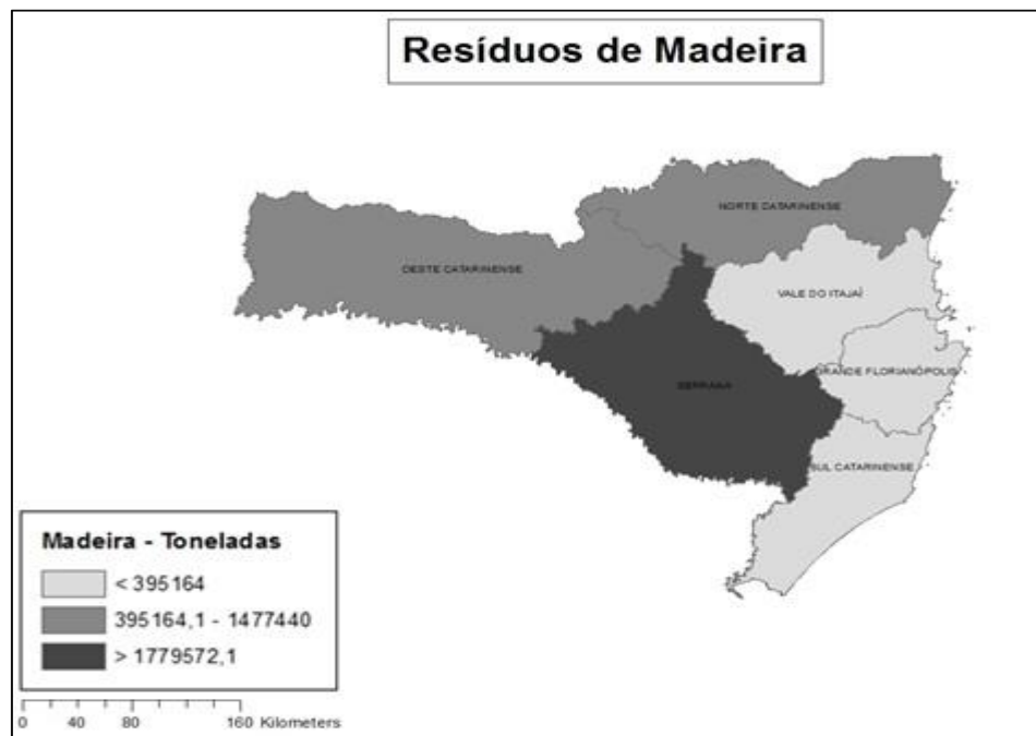
Figura 3 - Mapa ilustrando a disposição dos resíduos da silvicultura nas mesorregiões de Santa Catarina. Figure 3 - Map illustrating the distribution of forestry residues in the mesoregions of Santa Catarina.