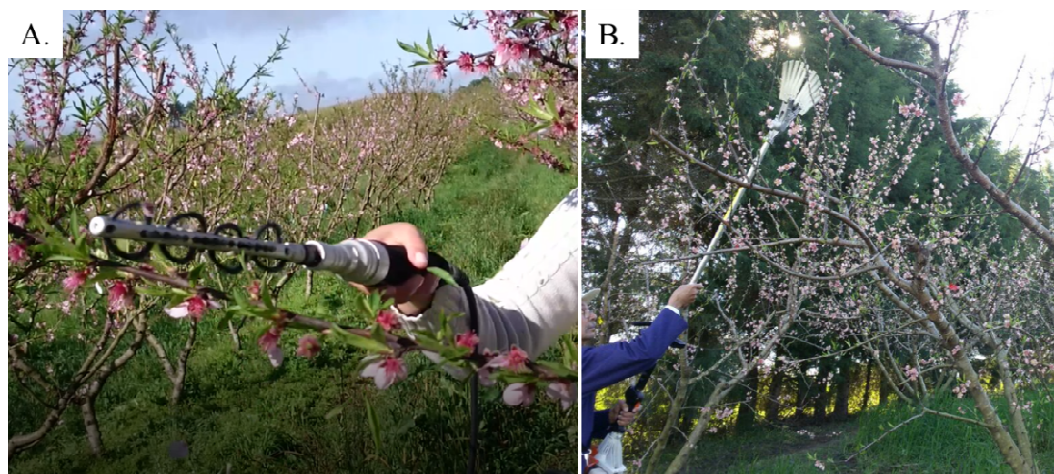
Figura 2. Equipamentos Carpa Electro ® (A) e “derradeira” (B) usados no raleio mecânico de flores e frutos de pessegueiros.

15 cm de distância entre os frutos. A plena floração dos pessegueiros ocorreu no dia 09 de agosto em 2017.